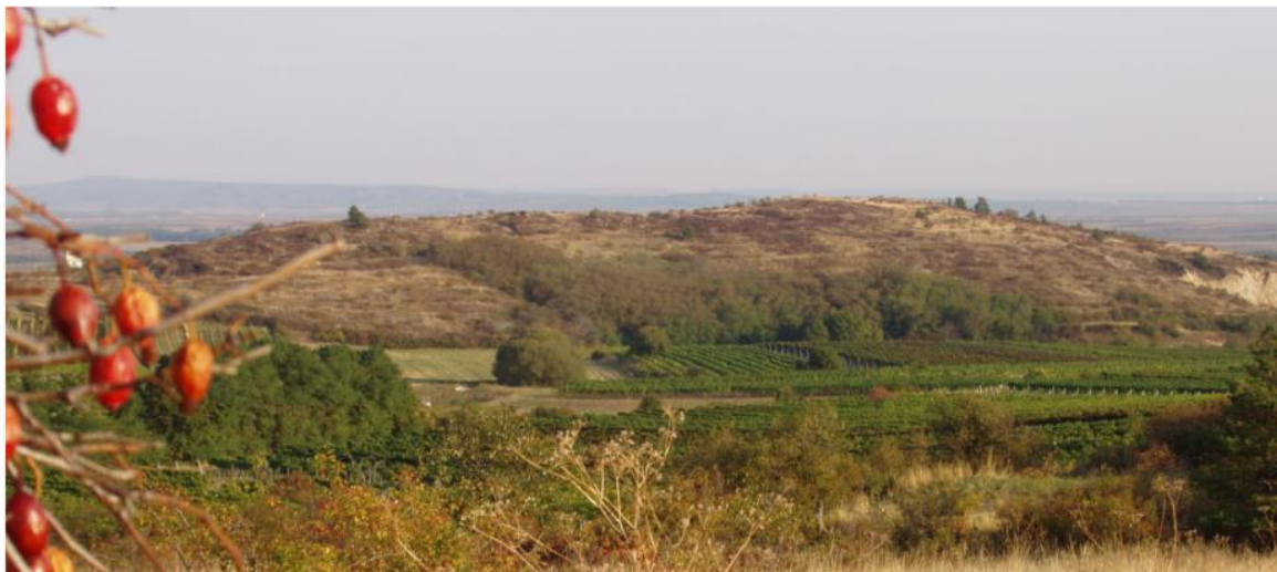
Abb. 2: Westseite des Gollitsch; ©G. Bassler.