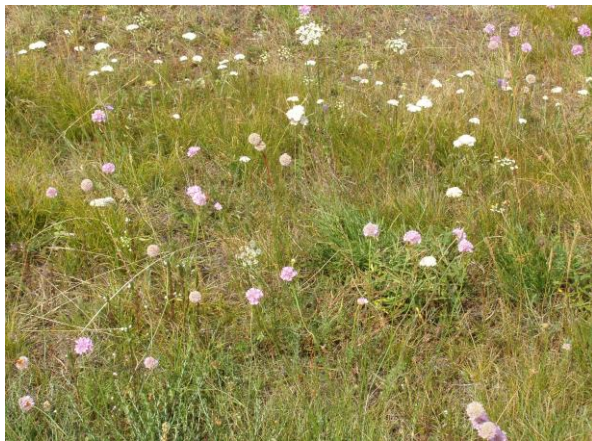
Abb. 5: Intakter Trockenrasen mit der gefährdeten Sand-Grasnelke ( Armeria elongata ); ©G. Bassler.