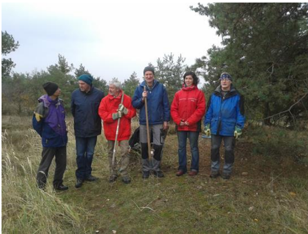
Abb. 16: Team vom 12.11.2016 mit Freiwilligen aus Retz