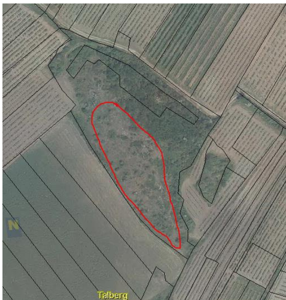
Abb. 12: Talberg: Entfernung von dichtem Robiniennachwuchs, KG Obernalb; (Quelle Atlas NÖ).