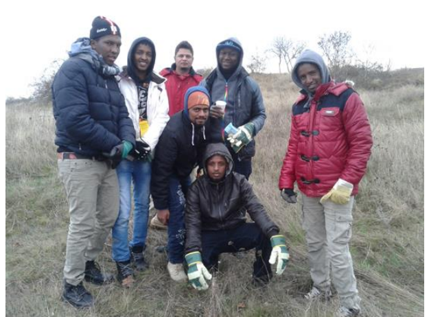
Abb. 17: Team vom 14.11.2016 mit Flüchtlingen