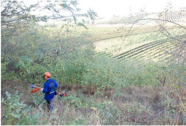
Abb. 14: Arbeit mit dem Freischneider; ©G. Bassler.