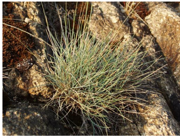
Abb. 6: Silikat-Fels-Trockenrasen mit Bleich-Schwengel ( Festuca pallens ); ©G. Bassler.

Die Trockenrasen beherbergen auch zahlreiche gefährdete Tierarten, darunter die Smaragdeidechse (s. Abb. 8), Heuschrecken-Arten wie z. B. den Schwarzfleckigen Heidegrashüpfer ( Stenobothrus nig-