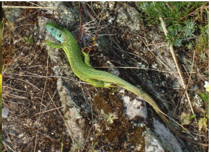
Abb. 8: Smaragdeidechse ( Lacerta viridis ); ©G. Bassler.