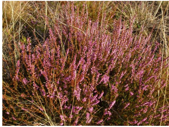
Abb. 4: Heide mit Heidekraut ( Calluna vulgaris ); ©G. Bassler.