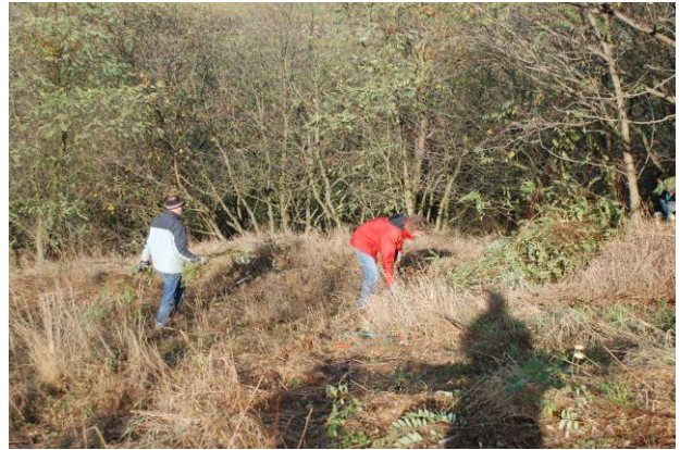
Abb. 15: Gehölzabtransport mit freiwilligen Helfern aus Retz; ©G. Bassler