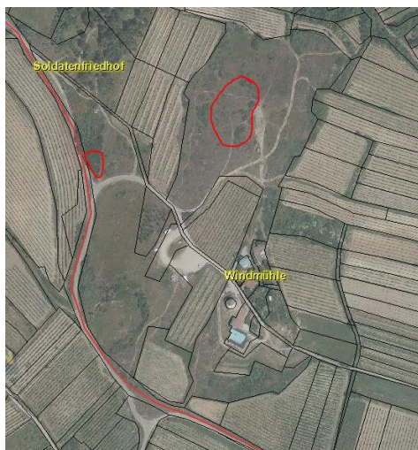
Abb. 10: Bereiche mit weggeschnittenen Robinien bei der Retzer Windmühle (westliche Fläche) bzw. beim Kalvarienberg (östliche Fläche) (KG Retz Altstadt); (Quelle: Atlas NÖ).

Sämtliche Arbeiten wurden von der Autorin ökologisch begleitet (Auswahl der wegzuschneidenden Gehölze, Lagerung des Schnittgutes).