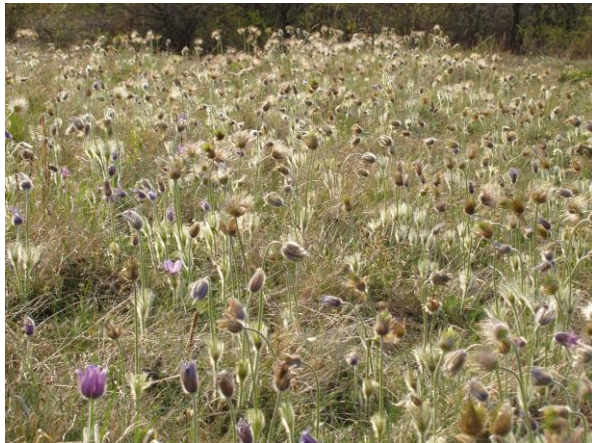
Abb. 3: Kuhschellen-Trockenrasen mit Großer Kuhschelle ( Pulsatilla grandis ); ©G. Bassler.