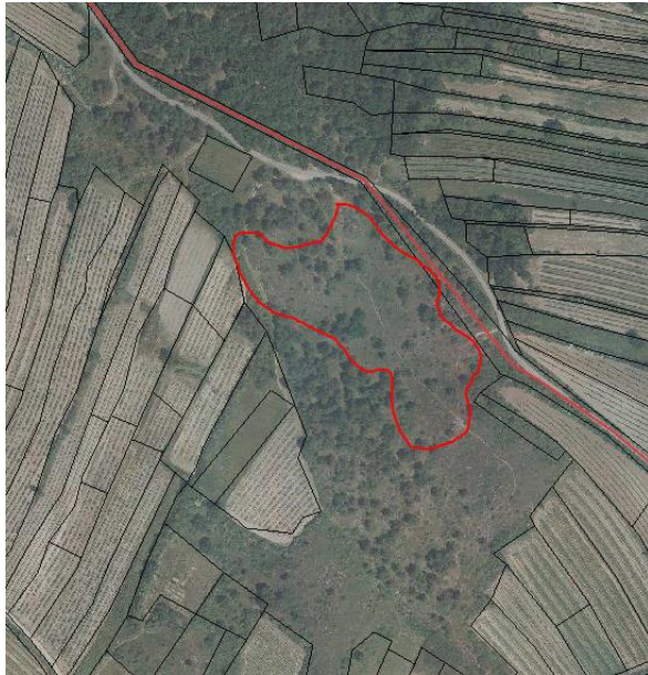
Abb. 11: Parapluieberg (KG Obernalb): Entfernung von dichtem Rosennachwuchs und einzelnen Föhren; (Quelle Atlas NÖ).