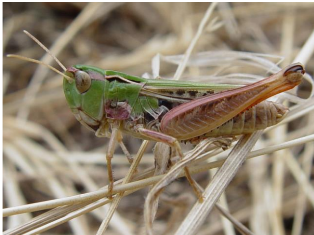
Abb. 9: Schwarzfleckiger Heidegrashüpfer ( Stenobothrus nigromaculatus ); ©M. Denner.