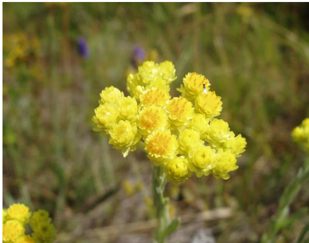
Abb. 7: Sandstrohlblume ( Helichrysum arenarium ); ©G. Bassler.

romaculatus ) (Abb. 9) (eines der größten niederöstr. Vorkommen), Schmetterlingsarten wie z. B. den Rotbindigen Samtfalter ( Arethusana arethusana ), der in den silikatischen Trockenrasen der nördlichen Manhartsberglinie eines von den drei niederösterreichischen Verbreitungsgebieten hat. Im Gebiet westlich von Retz kommt auch die Heidelerche vor.