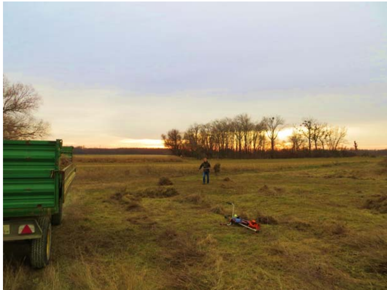
Mahd Köhlergrube

Eine neuerliche komplette Entbuschung sowie wie eine Fortführung der Mahd wäre wünschenswert.