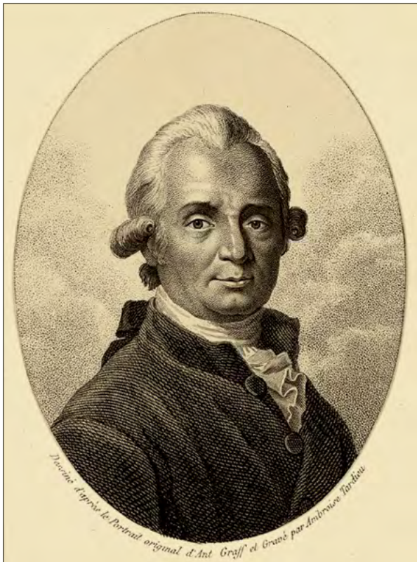
Slika 1. Portret berlinskega zdravnika in naravoslovca Marcusa Elieserja Blocha, avtorja 'Splošnega prirodopisa rib' ( Allgemeine Naturgeschichte der Fische ), najpomembnejšega ihtiološkega dela 18. stoletja.

Figure 1. Portrait of Marcus Elieser Bloch, a Berlin physician, naturalist and author of the ' Allgemeine Naturgeschichte der Fische '; the most important ichthyological work of the 18th century.