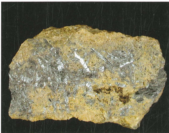
Antimonit iz Lepe Njive je običajno v nekaj centimetrov dolgih kristalih, ki se med seboj prepletajo; 73 x 46 mm. Najdba in zbirka Staneta Lamovška.

Okremenjeni in nato orudeni del Lepe Njive je deloma permški apnec, največji obseg ima v spodnjetriasnem apnencu, apnenčevem peščenjaku in meljevcu, v manjši meri sta okremenitev in orudenje zajela apnec ladinijske in karnijske starosti ter v največjem obsegu bazalne oligocenske konglomerate.