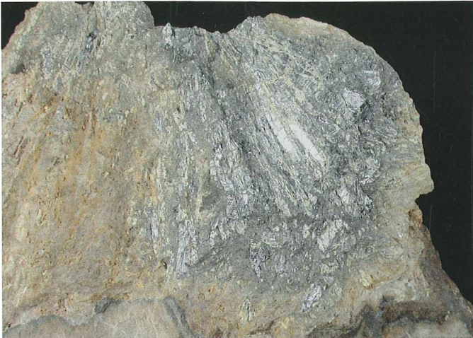
Žarkasto razviti prizmatski kristali antimonita iz Lepe Njive; 60 x 45 mm. Najdba in zbirka Staneta Lamovška. Foto: Miha Jeršek

Okremenjena kamnina je po barvi in mineralni sestavi zelo podobne jaspisu, zato jo imenujemo jaspisoid. To so metasomatska telesa, v katerih sta se iz kislih hidrotermalnih raztopin hkrati z raztapljanjem kalcita na njegovo mesto izločala kalcedon in kremen. V njih so našli nenadomeščene preostanke – relikte prvotnih laminiranih kamnin. Večina okremenjenih kamnin ima brečasto teksturo.