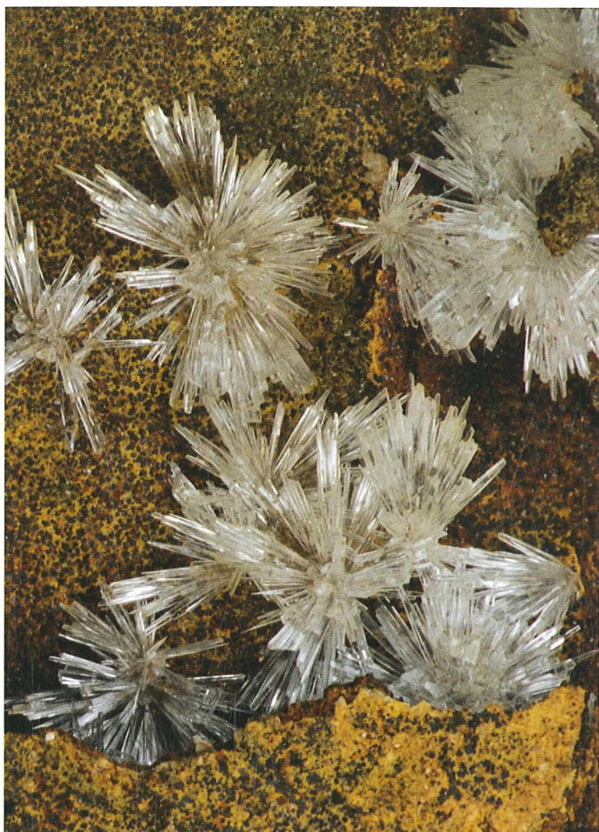
Aragonitni ježki s premerom do 25 mm iz rova pri Slakah so med najlepšimi v Sloveniji. Zbirka Staneta Lamovška.

V tektonskem smislu pripada Rudnica vzhodnemu podaljšku Posavskih gub. Plasti so izoblikovane v obsežne antiklinale in sinklinale, ki potekajo v smeri vzhod-zahod. Ozemlje sekajo številni, tudi zelo dolgi prelomi, največ v dinarski smeri.