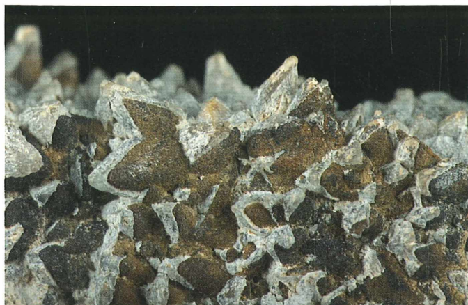
Detalj kristalov kalcita z limonitno prevleko; izrez 30 x 20 mm. Najdba in zbirka Gorana Schmidta.

počasno odnašanja žvepla iz sulfidov. Pri oksidacijskih pogojih je železo nemobilno. Na mestu se je povezalo s kisikom in vodikom v minerale limonita, ki je ohranil predhodno obliko.