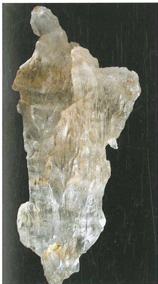
Korodiran kristal sadre; 60 x 26 mm. Najdba in zbirka Franca Goloba.

Poleg kalcita lahko na področju zgornjekrednih plasti najdemo še druge minerale. Vsakega obiskovalca najprej pritegnejo vložki črnega premoga, ki so v izrazitem kontrastu z okolno kamnino. Kmalu lahko ugotovimo, da je celotno ozemlje obogateno z