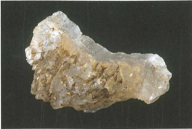
Sadro najdemo v kamnolomu Stranice v bližini premogovih plasti; 45 x 60 cm. Najdba in zbirka Vilija Podgorška.

železovimi minerali, saj so tako na apnencu kot na premogu številne limonitne prevleke . Glavni razlog za nastanek limonita so drobni kristali pirita , ki ga najdemo običajno kot oprh na premogu ali pa, zelo redko, kot piritne skupke.