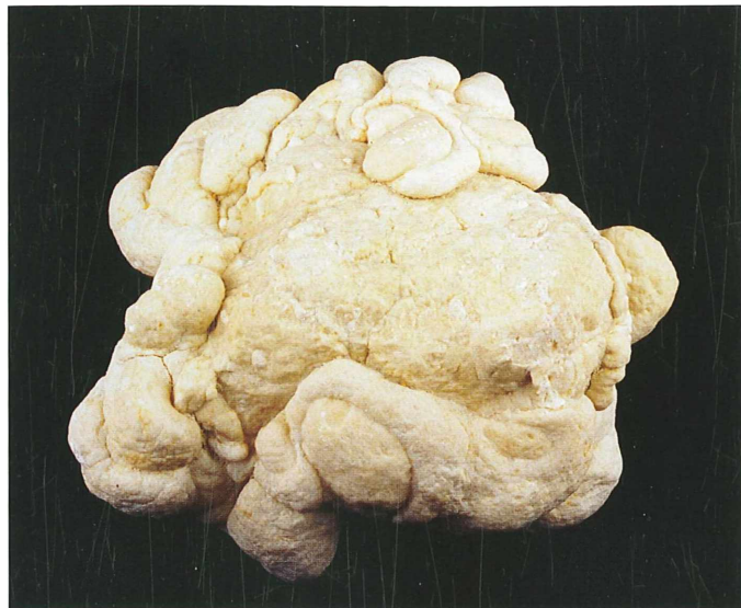
Gomoljast skupek kalcita; premer 13 cm. Najdba Franca Pajtlerja, zbirka Prirodoslovnega muzeja Slovenije.