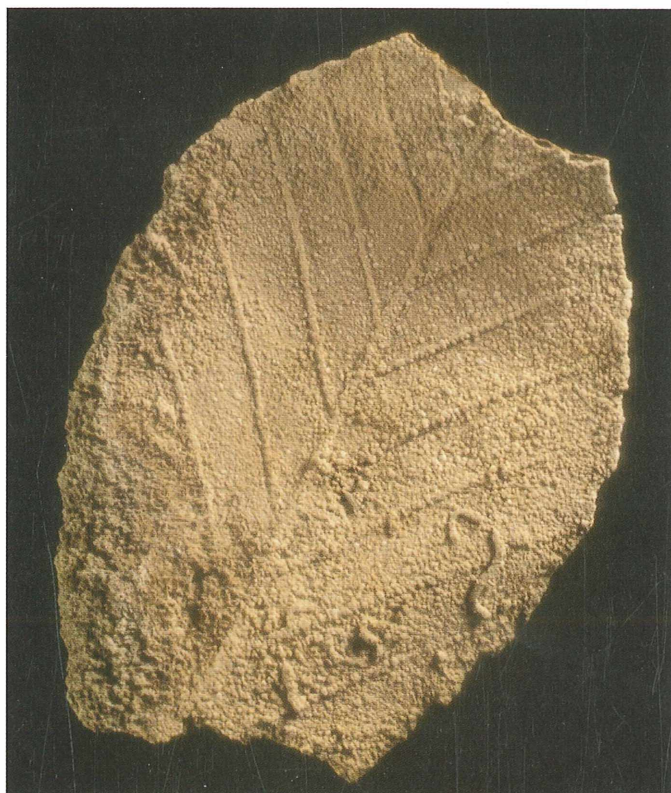
Lepo ohranjen list, prekrit z lehnjakom, najden ob slapu Kobilji curek pri Velikih Laščah; 6 cm. Najdba in zbirka Renata Vidriha. Foto: Marijan Grm

sedimenta. Še rastoča debela in veje so obdane s skorjami lehnjaka. Marsikje so vidni prehodi iz lehnjaka v hitrorastoči koreninski in zeleni površinski del vodnega mahu. Voda iz izvira se v vršaju razliva v več različno hitrih tokov, ki dodatno pogojujejo hitrost in tip nastalega lehnjaka. Čeprav se v hitreje tekoči in turbulentni vodi karbonat načeloma izloča hitreje, pa je njena erozijska moč prevelika, da bi se odložil. Nastajanje lehnjaka je v tem primeru hitrejše iz počasneje tekoče vode in pa tam, kjer se izločeni karbonat v mirnejšem okolju ujame – sedimentira na mahu in drugem rastlinju.