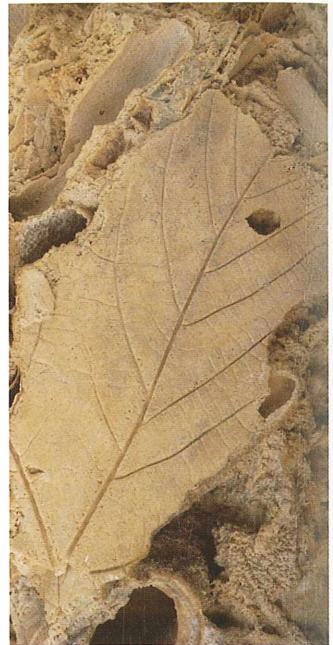
Inkrustiran list leske z Jezerskega; izrez 35 x 20 mm. Zbirka Oddelka za geologijo Naravoslovnotehniške fakultete Univerze v Ljubljani.