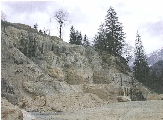
Kamnolom lehnjaka na Jezerskem leta 2005.

Kadar je karbonat izločen v manj poroznih ritmično ponavljajočih se plasteh, nastaja gostejši in trdnejši travertin, ki je pri nas redkejši. Med lehnjakom in travertinom ni jasne meje. Kamnino poimenujemo glede na prevladujočo značilnost. Sestavlja jo največ kalcit, ki se izloča iz vod, v katerih je poleg kalcija tudi več magnezija, pri višjih temperaturah pa se hkrati izloča tudi aragonit. Različice travertina, ki so jih že v antiki uporabljali za izdelavo okrasnih predmetov, so – drugače kot navadni alabaster, ki je iz mehkejše drobnozrnate sadre – imenovali apnenčasti alabaster. Kompaktni in običajno prosojni plastnati travertin ali skorjasto jamsko sigo, ki jo je mogoče dobro polirati in zato uporabiti kot okrasni kamen, trgovci le zaradi podobnega videza imenujejo oniks marmor, kar je strokovno povsem neustrezno, saj