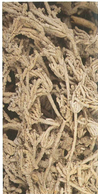
Inkrustiran mah z Jezerskega; izrez 4 x 2 cm. Zbirka Oddelka za geologijo Naravoslovnotehniške fakultete Univerze v Ljubljani.

Karbonat se izloča na tamkajšnjem mahu, drevesih in drugih rastlinskih ostankih. Le-ti na površini ponekod še niso povsem prepereli, zato se menjavata organski in anorganski del