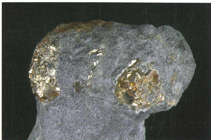
Delno limonitizirani skupki piritov v glinavcu; izrez 40 x 30 mm. Najdba in zbirka Gorana Schmidta.

Drugo nahajališče je v podaljšku istih plasti na desnem bregu Bistrice, kamor pridemo čez most v bližini geološkega stebra. Tam naletimo na kremenove konglomerate s številnimi prodniki kremenovega peščenjaka in skrilavega glinavca. Konglomerat prehaja navzgor v kremenov peščenjak z redkimi plastmi skrilavega glinavca. Prelomu sledi temnosiv apnenec, ki prehaja v svetlejšega z mnogimi žilami kalcita. V tem apnencu lahko najdemo številne kristale pirita, ki so lahko v obliki kock, pa tudi pentagonskega dodekaedra. Večinoma so manjši kristali, veliki do 1 mm, pa tudi večji in lepo oblikovani.