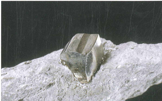
Kristal pirita z razvitimi ploskvami kocke in pentagonskega dodekaedra iz Dolžanove soteske; kristal 4 mm. Najdba in zbirka Vilija Rakovca.