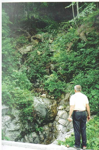
Vznožje pobočja, kjer izdajajo glinavci s piriti.

V Sloveniji je več nahajališč pirita, le ponekod pa je tudi v zelo lepih kristalih. Fran Erjavec navaja, da so ga našli na več krajih po Kranjskem, Koroškem in Štajerskem, še posebno lepi kristali pa da so pri Sv. Lovrencu in pri Sv. Mariji v Puščavi. Wilhelm Voss omenja pirit iz Savskih jam, Poljan pri Škofji Loki, Črnuč pri Ljubljani, Golovca, Osredka pri Dolskem, Spodnjih Gorij, Litije, iz Selške doline, s Kope v dolini Kamniške Bistrice, iz Idrije ter iz premogovnikov Zagorje in Trbovlje. Vidrih in Mikuž omenjata pirite iz Janezovega grabna nad Zgornjo Polskavo, Dolžanove soteske, Blagovice, Cezlaka na Pohorju, Velike Pirešice, Čeplja pri Vranskem, Štrihovca pri Šentilju, Lemberga pri Šmarju, Raven na Koroškem, Drenovega griča, Šentilja, Pece, med Vrhniko in Logatcem, Stranic pri Slovenskih Konjicah, Kamne Gorice, danes pa se odkrivajo nova nahajališča, predvsem na gradbiščih avtocest ipd. Sklenemo lahko, da je pirit takorekoč vsepovsod.