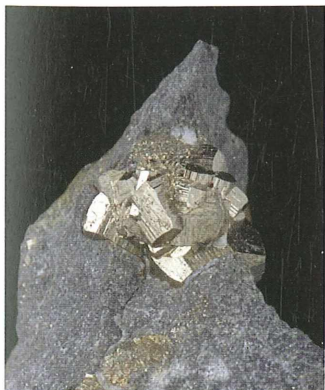
Kristali pirita v glinavcu iz Dolžanove soteske; 13 x 10 mm. Najdba in zbirka Gorana Schmidta.

Pred približno dvema desetletjema smo kristale pirita našli v že omenjeni Dolžanovi soteski. Največji kristali pirita merijo celo do 4 cm. Pirita po vsej verjetnosti ne bi našel nihče, če ne bi bil ob nahajališču fosilov, ki so ime Dolžanove soteske ponesli v svetovno literaturo in privlačijo pozornost raziskovalcev. V neposredni bližini nahajališča pirita je bil v preteklosti kamnolom, kjer so pridobivali apnenec. Po gori Trogkofel v