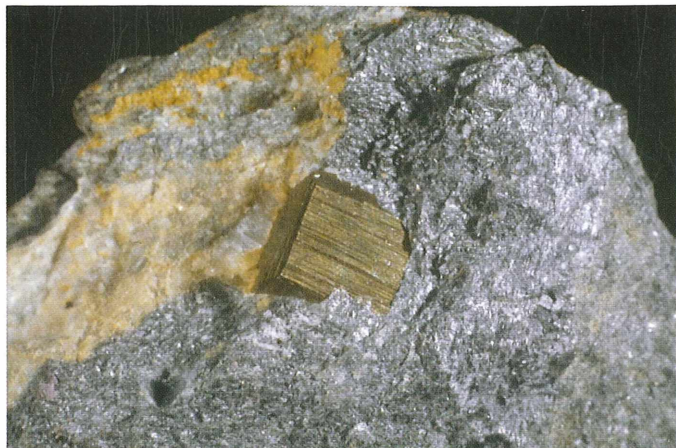
Kockast kristal pirita meri 6 mm. Najdba in zbirka Renata Vidriha.