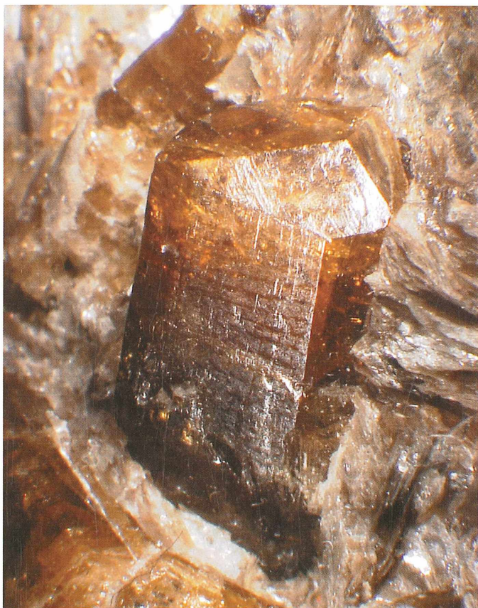
Kristal dravita v margaroditnem blestniku; 13 x 6 mm. Dobro vidna je narebrenost na ploskvah prizme in napokanost zaradi tektonskih procesov. Zbirka Prirodoslovnega muzeja Slovenije.

Po skoraj četrstoletja smo leta 2005 zopet obiskali Čevnikove in gospa se je še vedno spominjala našega prvega obiska. Skupaj z njenim možem smo osvežili dogodke iz preteklosti. Povedala sta, da so leta 2003 ob polaganju tlakovcev na dvorišču spet našli kristale, ki pa niso bili tako lepi in veliki. Ponovno smo si ogledali tudi primerke dravita, ki jih gospa še vedno skrbno hrani.