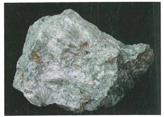
Antofilit s Košenjaka; 5 x 3 cm. Najdba in zbirka Zmaga Žorža.