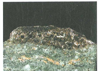
Flogopit na aktinolitu s Košenjaka; 5 x 3 cm. Najdba in zbirka Zmaga Žorža.