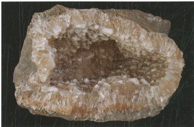
Geoda, zapolnjena z rjavorumenimi kristali kalcita; 7 x 4 cm. Najdba in zbirka Vilija Rakovca.

Pri razbijanju posameznih blokov lapornatega apnenca pa se pokažejo majhne votline z drobnimi kristali kalcita , velikimi do 4 mm. Votline so okrogle ali ovalne oblike in spominjajo na