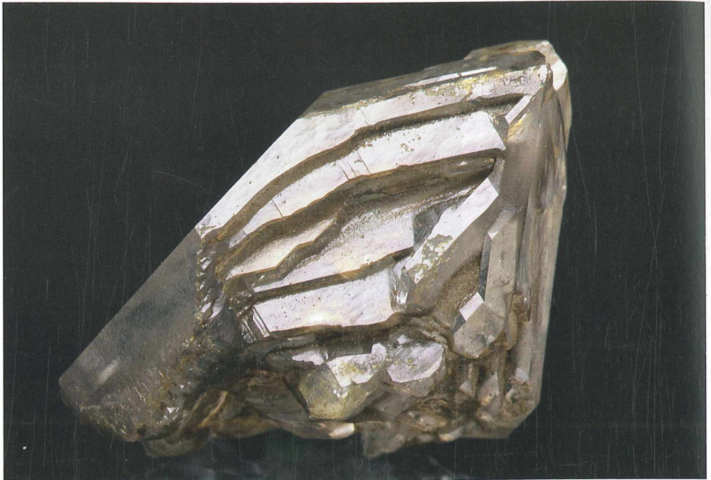
Veliko kristalov kremenca v Dobrini ima izrazito skeletne ploskve; 40 x 27 mm. Najdba in zbirka Vilija Podgorška.

razpoke je v dolžini več metrov potekala trdna plast peščenjaka, podobna nekakšni pregradi, zato smo kopali predvsem levo od glavne razpoke, da se je prostor razširil in omogočal napredovanje. Glavni razpoki je sledilo še več manjših, ki so se izklinjale, nato pa spet na novo odpirale. Zapolnjene so bile s preperelo kamnino in rastlinskimi ostanki. Veliko kremenovih kristalov je bilo že razpokanih. Skoraj vsi kristali imajo razpoke, v katere se je zalezla preperina, ki jo je težko očistiti. Kristali so zato motni, kar je najbolj vidno pri večjih primerkih.