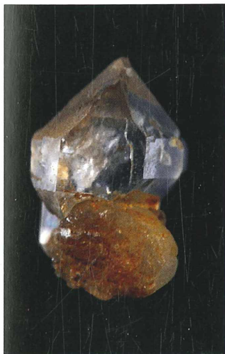
Kristal izrašča iz manjšega kremenovega prodnika, kar je svojevrstna posebnost dobrinskega nahajališča; 15 x 10 mm. Najdba in zbirka Vilija Podgorška.

Po več obiskih nahajališča smo ugotovili, da glavna razpoka s kremenom poteka diagonalno preko odkopanega mesta in se nadaljuje v pobočju vzporedno s površjem. Plitvo pod površino smo zato izkopali skoraj deset metrov dolg rov. Delo so ovirale drevesne korenine in pomanjkanje svetlobe. Na dveh mestih smo do površja izkopali nekakšen zračnik, ki je osvetljeval čelo izkopa. Razpoka je bila ponekod široka skoraj 20 centimetrov, zato smo lahko z roko otipali kristale. Največji primerki so bili kot nekakšni stebri postavljeni prečno na razpoko. Na desni strani