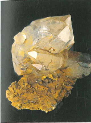
Dva razgibana kremenova kristala sta priraščena na podlagi iz manjših kristalov kremen; 40 x 36 mm. Zbirka Vilija Podgorška.

sedem priraščenih con. Tudi primerki obojestransko zaključenega, biterminiranega skeletnega kremenja so lahko dolgi do 6 cm. Kristale, ki so vzporedno zraščeni iz desetih kristalov z razvitimi ploskvami in so obojestransko zaključeni, smo poimenovali snopasti kremen . Ti so tudi največji, preko 10 cm.