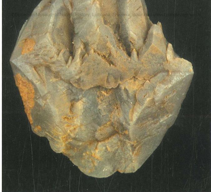
Bazalni dvojček kristalov kalcita s skaleñoedrskim habitusom; višina 58 mm. Najdba in zbirka Vilija Podgorška.

med njimi pa so tudi več centimetrov veliki dvojčki. Ker so bili blizu površja, so večinoma korodirani. Zaradi vključkov gline so nekateri sivi, po površini pa imajo še limonitne prevleke. Največji merijo do 7 cm.