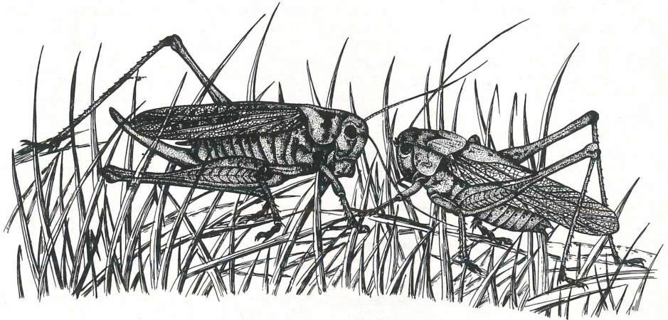
Abb. 1: Decticus verrucivorus L., Männchen und Weibchen

Zum Heranwachsen sind für die Larven jedoch sehr hohe Temperatursummen erforderlich, die nur an solchen Stellen erreicht werden, wo der Boden durch mög-