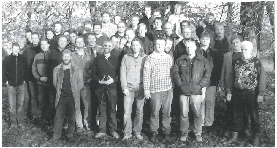
Mehr als 40 Ehemalige kamen zum 30jährigen Jubiläum zusammen.

Gut 40 ehemalige Zivis trafen sich am 19.11.2005 im Haus der Natur zu einem Ehemaligentreffen ein. Eine illustre Runde vom Bodensee bis Flensburg in allen Altersklassen. Es war für etliche Teilnehmer ein Wiedersehen nach vielen Jahren. Da gab es natürlich ungeheuren Gesprächsstoff: von Besonderheiten aus den Naturschutzgebieten, den Erlebnissen mit Touristen und natürlich vom Dienststellenleiter bis heute unentdeckte Missetaten.