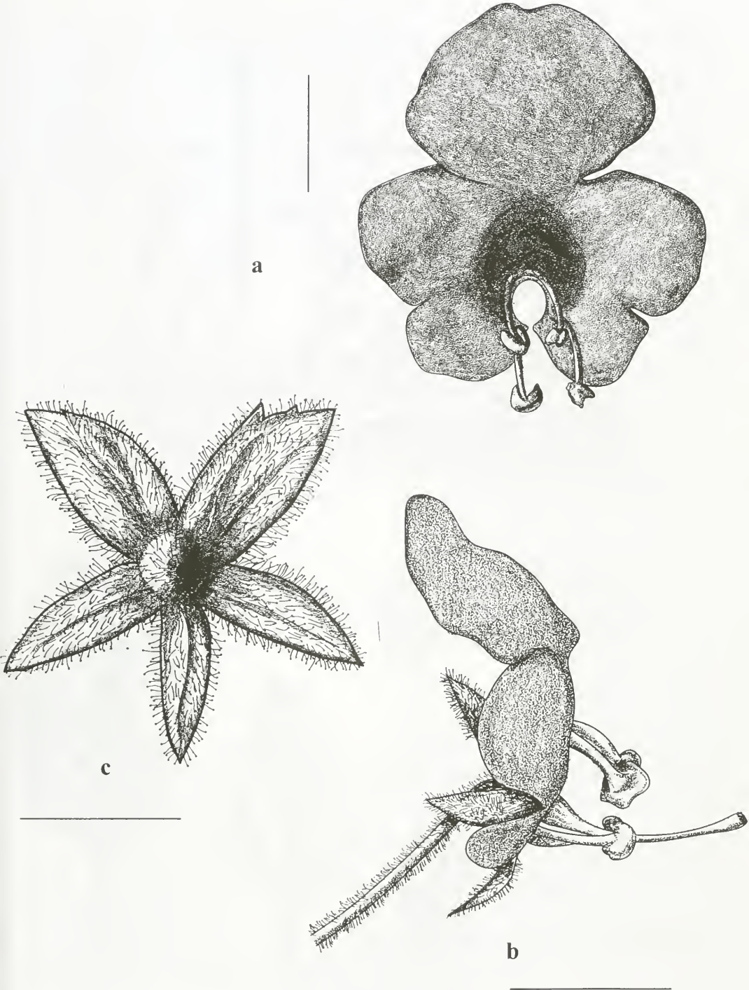
Abb. 1 a: Blütenkrone in der Aufsicht; b: Blüte von der Seite; c: Kelch von unten, Orientierung in der resupinierten Blüte. (alle Abbildungen nach kultiviertem Material der Typusaufsammlung). Maßstab 5 mm.