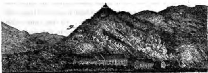
Die Hanselmannhöhlen bei Bad Ems.

Diese kalkhaltigen Schichten geben an dem Steilgehänge des sog. Baderlei (Concordia-Thurmberg) unterhalb des Kriegerdenkmals zu einer unter der Bezeichnung „Hanselmannhöhle“ in Ems als grosse Naturmerkwürdigkeit gerühmten Erscheinung Anlass. Die Sage bezeichnet nämlich