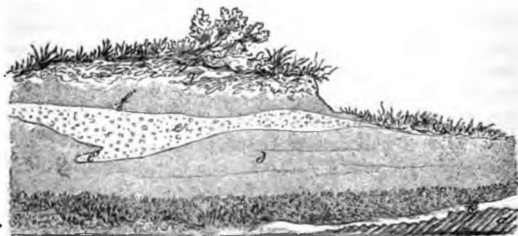
Profil am Wege von Ems nach Braubach.

(S. 441 u. ff.) und auch Sandberger 1) erwähnt im Lahnthale, besonders schön an der Weissmühle aufgeschlossene, 3—4' dicke Lössbänke auf Schichten von Bimsstein-Auswürflingen und schwarzem, vulkanischem Sand aufgelagert. Es dürfte jedoch für die Besucher von Ems nicht ohne Interesse sein, auf ein sehr ausgezeichnetes derartiges Profil in nächster Nähe des Bades aufmerksam gemacht zu werden. Dasselbe findet sich an der Strasse von Ems nach dem Lahnsteiner Forsthaus und Frücht an der grossen Krümmung, wo der Fussweg zum Gipfel des Wintersbergs sich abzweigt und wird durch nachstehende Skizze dargestellt.