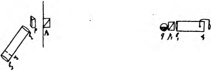
\frac{1}{4} der natürlichen Grösse.

mit einer dünnen Quarzplatte q senkrecht zur Axe geschliffen bedeckt ist. Diese dreht die Polarisationsebene des durch sie gehenden Lichtes um wenige Grade, und zwar für die verschiedenen Farben des weissen Lichtes verschieden viel. Nachdem es dies Diaphragma passiert hat, geht es entweder ungeändert, oder wenn eine Röhre mit Zuckerlösung im Spektrosaccharimeter liegt, durch diese, welche die Polarisationsebenen der einzelnen Farben des durch sie gehenden Lichtes dreht,