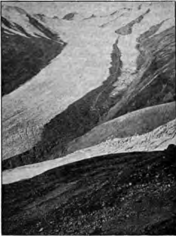
Fig. 1. Die Mittelmoräne des Hintereisferners. Die weisse (retouchierte) Linie bezeichnet die Lage der Schweissnaht.

Hauptsache nach aus der Innenmoräne stammt und nicht direkt von den aperen Felsen der Langtauferserspitze, an denen sie den Ausgang nimmt. Wenn man bedenkt, dass die schuttführende Wand nach den Gletscherprofilen von Blümcke und Hess in den oberen Teilen eine Höhe von 250 m hat, kann man an der Möglichkeit dieser Herkunft nicht zweifeln.