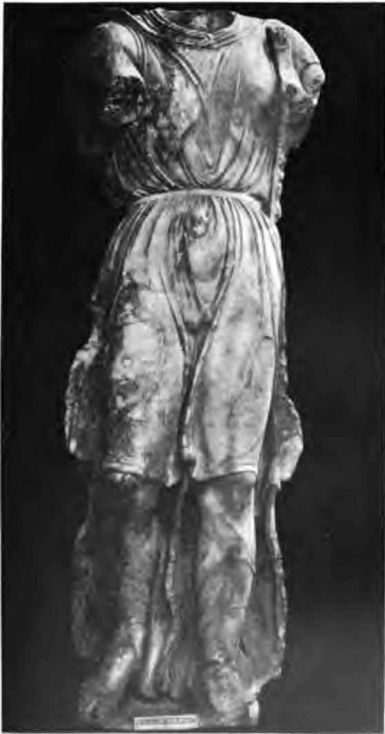
Giebelstatue Glyptothek Ny Carlsberg, Kopenhagen.