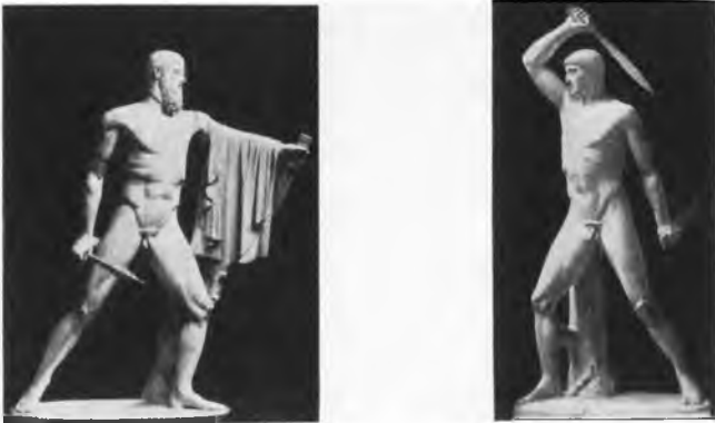
Abb. 2. (Dresden)

gegen den Beschauer zu, entladen zu lassen, stehen andere gegenüber, die in klarer Erkenntnis des flächigen Aufbaus der beiden Figuren die Hauptbewegung vor dem Beschauer vorüberführen. Dies konnte auf zwei Arten geschehen, in Gegenüberstellung und in Gleichrichtung der beiden Figuren. Die