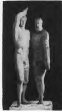
b: zu Abb. 16

gleiche Bild darbieten, so wie es etwa in Abb. S. 24 b erscheint. Die Täter gehen geschlossen vor. Wendung, Brust- und Kopfhaltung streben zusammen, die Blickrichtung geht nach vorne, eher etwas nach innen als nach außen. Die Schwerter sind zum Strich auf ein gemeinsames Opfer gezückt. Der Hauptfehler, den P. J. Meier (Röm. Mitt. 1905 S. 341) an der schmalen Vorderansicht der auseinanderbewegten Gruppe gerügt hatte, das getrennte Losstürmen auf verschiedene Ziele, scheint beseitigt. Viele werden einwenden, daß es auf diese Hilfsansicht nicht ankomme; die Flächigkeit der Figuren zeige, daß sich das Wesen der Gruppe in den beiden Breitansichten erschöpfe. Ein verhängnisvoller Irrtum! Die plastische Kraft, die innere Dreidimensionalität unterscheidet ein solches Werk zutiefst von „einansichtigen“ Werken der Spätzeit, Flächenbilder können es nie ersetzen; alle nur zeichnerischen Skizzen der Flächenansicht, alle Hinweise auf die antiken Flächennachbildungen erweisen sich als unzureichend oder irreführend gegenüber den Versuchen an den Abgüssen, in denen gerade die schmale Nebenansicht stets, und sei es nur „latent“, eine gewichtige Rolle spielt.