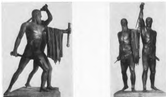
Abb. 1. (Braunschweig)

(Der schöne Mensch 2 S. 170 f.), Schweitzer (Pasquino S. 69) haben sie empfohlen, und so ist sie auch die Lieblingsaufstellung der Abgüßmuseen geworden. Ja sogar die Marmorstatuen des Neapler Museums wurden nach diesen Vorschlägen aufgestellt (Richter, Sculpture Fig. 571; L. Curtius, Antike Kunst II Abb. 189; Bull. com. 58, 1930, S. 121).