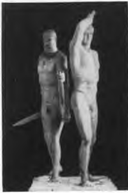
a: zu Abb. 10