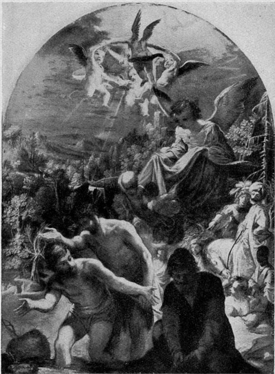
Abb. 4. Elsheimer, Die Taufe Christi, London