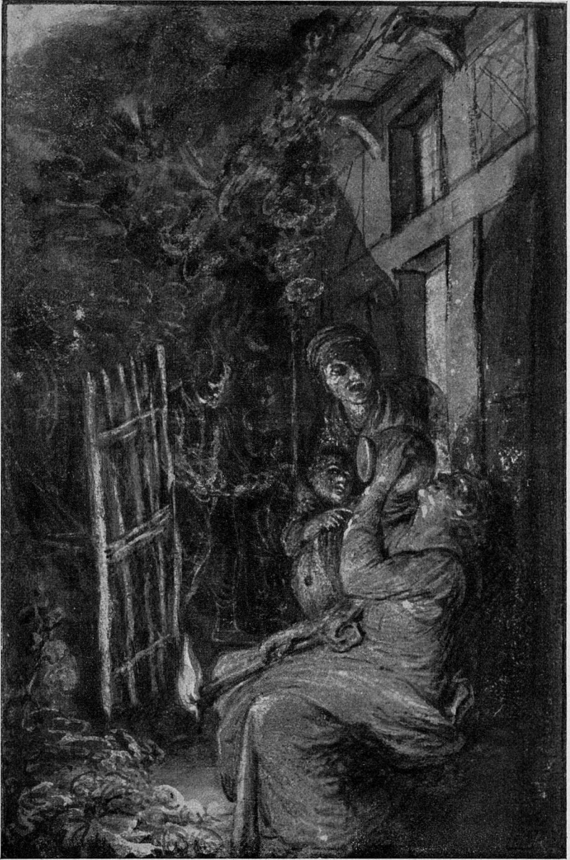
Abb. 12. Elsheimer, Die Verspottung der Ceres, Hamburg