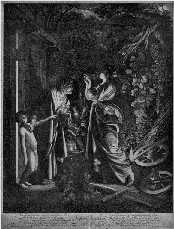
Abb. 6. Goudt nach Elsheimer, Die Verspottung der Ceres