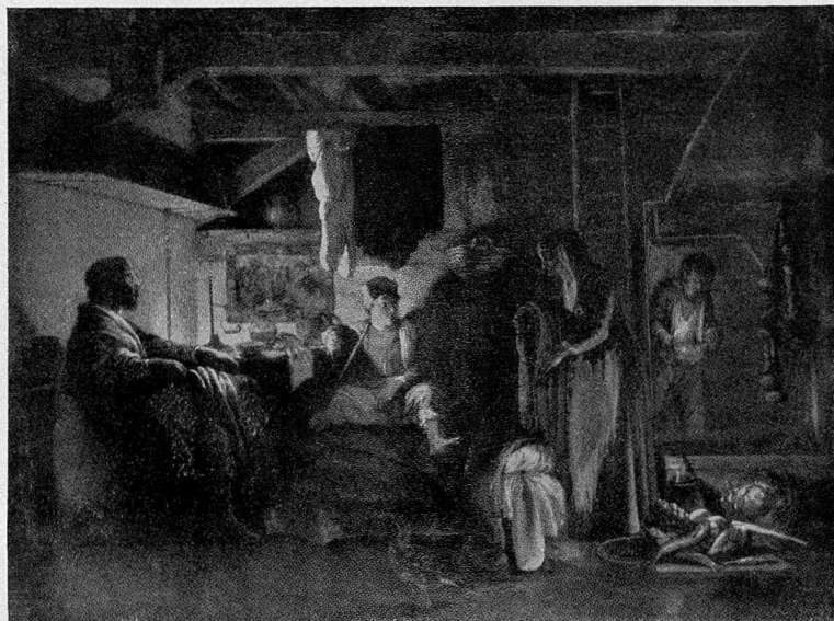
Abb. 10. Elsheimer, Jupiter und Merkur bei Philemon und Baucis, ehem. Dresden