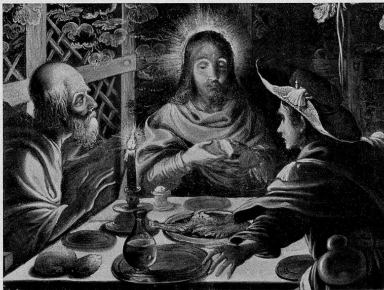
Abb. 9. Elsheimer, Das Emmauswunder (Ausschnitt)