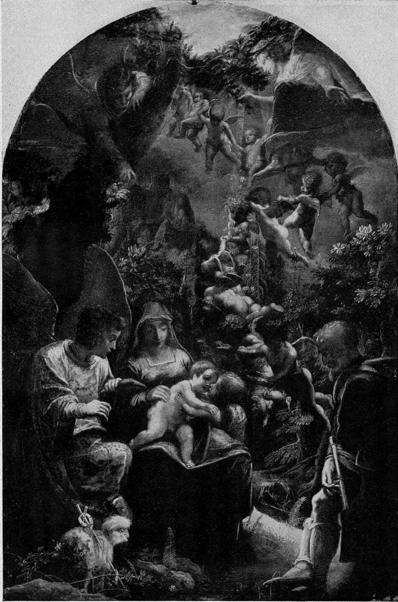
Abb. 1. Elsheimer, Die Ruhe auf der Flucht, Berlin