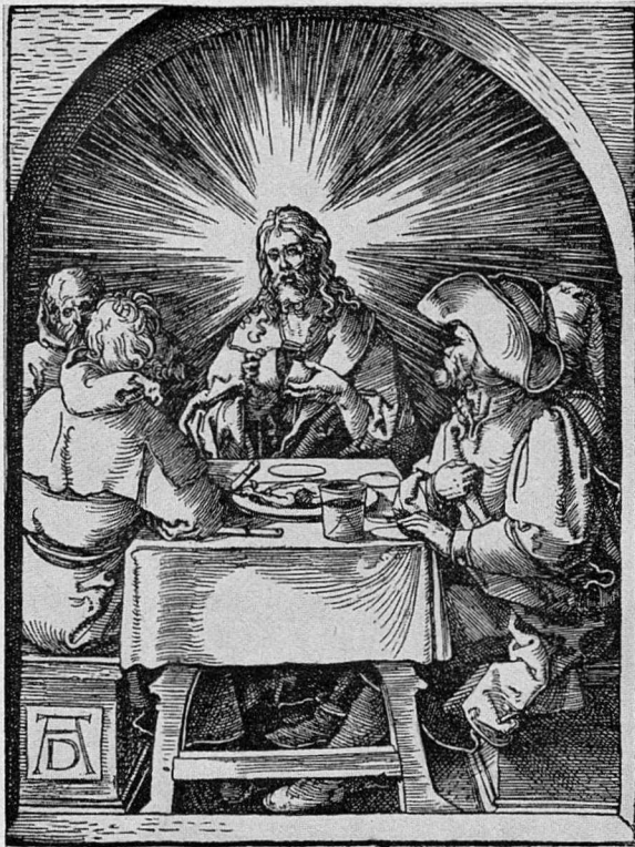
Abb. 7. Dürer, Das Emmauswunder