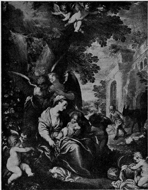
Abb. 5. Rottenhammer, Die Ruhe auf der Flucht, Schwerin