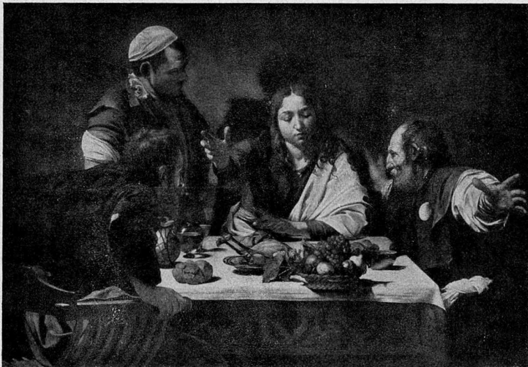
Abb. 8. Caravaggio, Das Emmauswunder, London