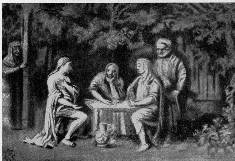
Abb. 11. Elsheimer, Das Emmauswunder, Frankfurt a. M.