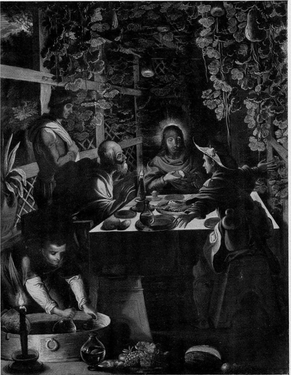
Abb. 3. Elsheimer, Das Emmauswunder, Schweiz, Privatbesitz