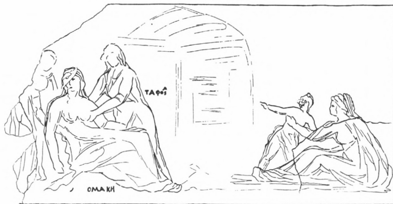
Abb. 2. Andromache an Hektors Grab. Fries mit Szenen der Ilias, Pompeji.