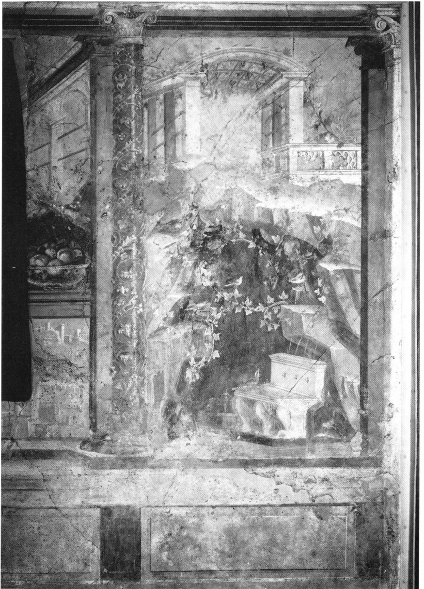
Rechte Hälfte der Rückwand des Schlafzimmers der Villa von Boscoreale. New York, Metropolitan Museum.