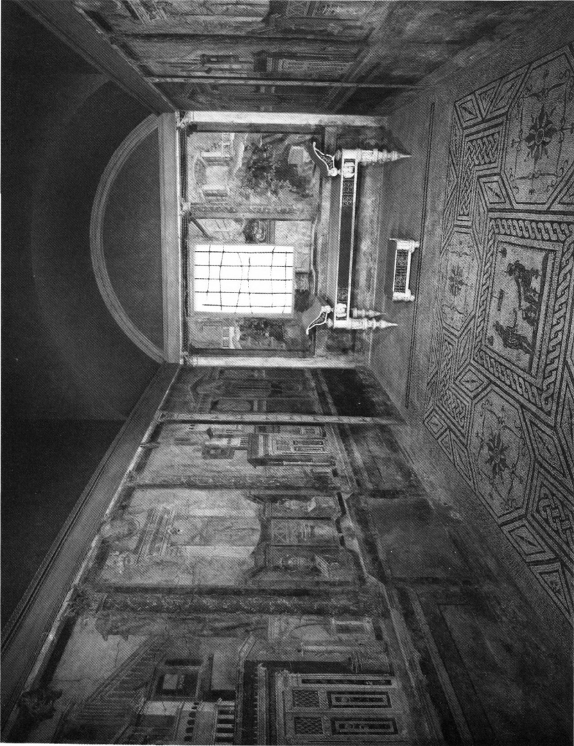
Schlafzimmer der Villa von Boscoreale, New York, Metropolitan Museum.