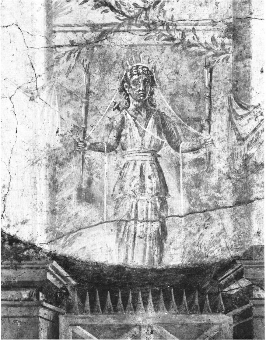
Statue der Artemis-Hekate mit Krone aus Uräusschlangen auf einem Wandgemälde der Villa von Boscoreale. New York, Metropolitan Museum.