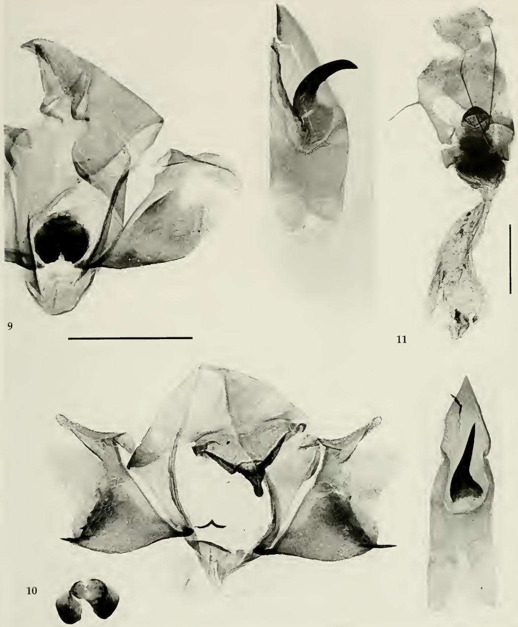
Abb. 9-11. Genitalapparate, Skala = 1 mm. 9. ♂ Genitalapparat von Phaselia joestleinae , spec. nov., Holotypus. 10. ♂ Genitalapparat von Phaselia deliciosaria (Lederer, 1855), S. Türkei. 11. ♀ Genitalapparat von Phaselia joestleinae , spec. nov., Paratypus.