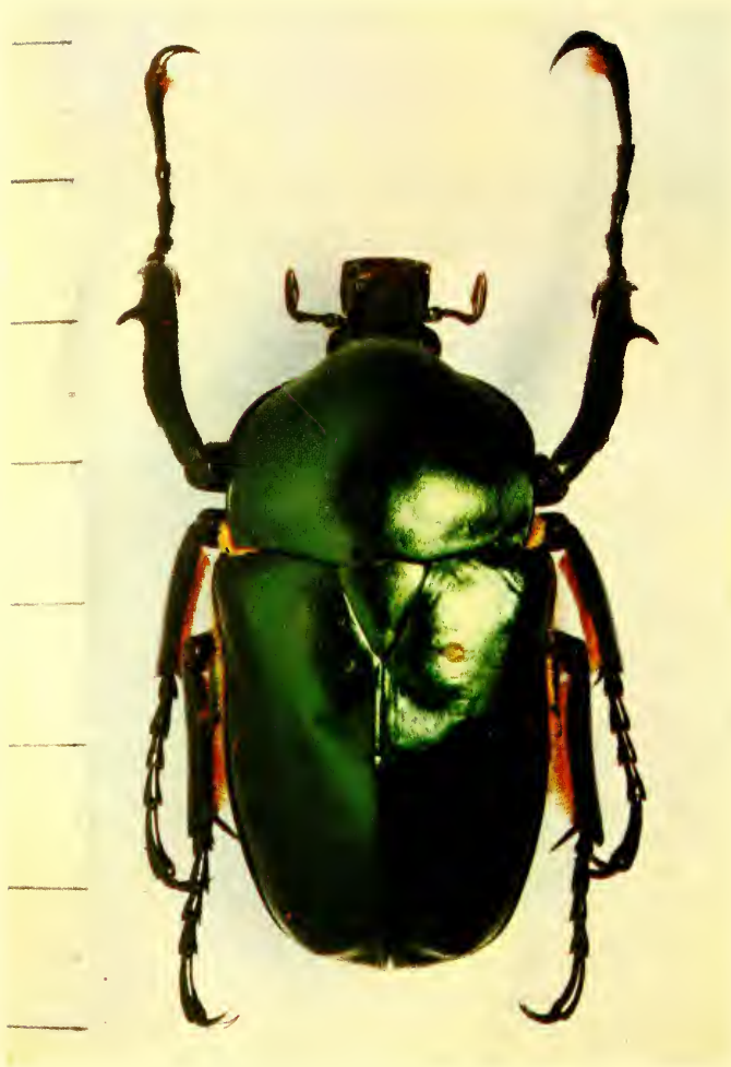
Jumnos ruckeri pfanneri nov. subspec.

läßt, d. h. nicht so hart und spiegelnd wie bei J. ruckeri ruckeri , was zunächst an eine eigene Art denken läßt. Innerhalb der schönen Serie von J. ruckeri pfanneri befindet sich jedoch ein ♀ Exemplar, das auf den Elytren geringe Spuren der gelben Zeichnung erkennen läßt (auf jeder Flügeldecke hinter der Mitte zwei kleine Punkte, vor der Mitte einen kaum sichtbaren gelben Punkt). Auch ist bei diesem Exemplar die Mikroskulptur feiner, die Oberfläche daher glänzender, ähnlich J. ruckeri ruckeri . Unterschiede der beiden Rassen erkennt man ebenfalls, wenn man die Tiere von der Seite betrachtet. Die Tiere aus Malaya sind weniger gewölbt, d. h. nach hinten etwas flacher, daher, von oben betrachtet, fast etwas breiter wirkend. Bei den vorliegenden Exemplaren ist zudem ein stärkerer Sexualdimorphismus in der