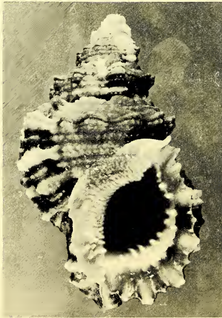
Abb. 4: Tutufa rubeta , Unterseite, 76 mm, Daressalam