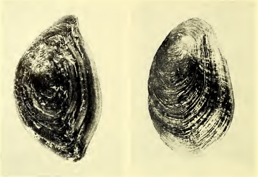
Abb. 3: Tutufa rubeta , Operculum