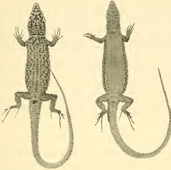
Abb. 3: Ventralansicht von Podarcis muralis kefkenensis , links ♂, rechts ♀.