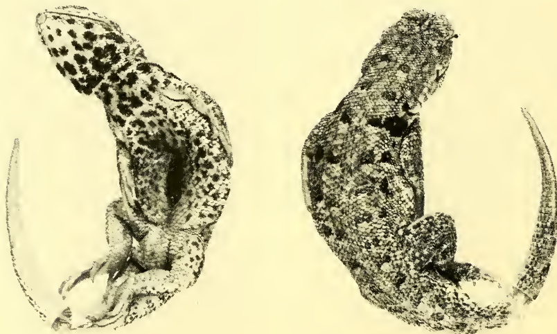
Fig. 3: Liolaemus scapularis sp. n. Holotype A. Vue dorsale; B. Vue ventrale.

Diagnose: Une espèce de taille assez petite, de coloration pâle, deux grandes taches noires arrondies sur l'épaule, nombreuses taches noires arrondies sur la gorge, la poitrine et le ventre, symphysiale étroite, narines supères et peu éloignées, pores préanaux présents chez la femelle.