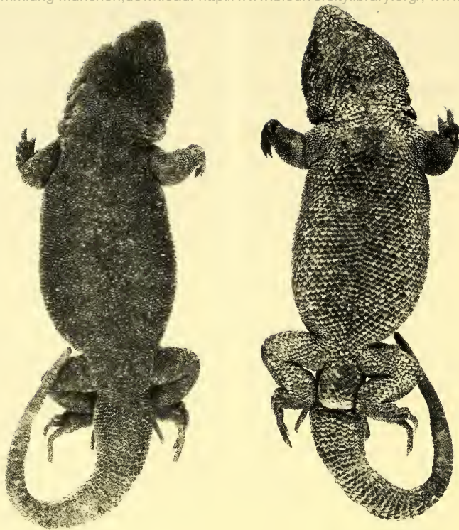
Fig. 1: Liolaemus forsteri sp. n. Holotype A. Vue dorsale; B. Vue ventrale.

Description: Narines obliquement orientées vers les côtés et le dessus. Rostrale environ deux fois plus large que haute. Ecailles de la tête, bombées et cabossées. Deux internasales bordant la rostrale, suivies de 4 écailles dont les 2 externes (supranasales) sont allongées. Entre ces écailles et les préfrontales, à peine reconnaissables, une zone vaguement pentagonale comprenant 17 écailles irrégulières parmi lesquelles on peut distinguer 3 impaires et 6 paires, plus 2 écailles intercalaires petites et asymétriques. Frontale divisée en trois, dont la portion antérieure creusée de deux sillons en y, et deux portions postérieures, celles-ci séparée des écailles pariétales par un groupe de 5 écailles. Interpariétale pyriforme et déprimée, suivie d'une petite écaille comprimée latéralement, elle même flanquée de deux écailles relativement grandes et hautes qui semblent être les pariétales. Cinq sus-oculaires, séparées de la zone frontale (interorbitaire) par une rangée d'écailles et des surciliaires par 3 rangées d'écailles. 9 à 11 surciliaires, divisées en 1) un groupe antérieur de 5 ou 6 dont la première s'étend sur la région frénale, étant séparée de la nasale par deux écailles, les suivantes se recouvrant jusqu'à la dernière et 2) en groupe postérieur de 4 ou 5 qui se suivent plus ou moins normalement. Une seule série d'écailles entre la sous-oculaire et les labiales supérieures. 11–12 labiales supérieures, bordées d'autres écailles intrabuccales plus peti-