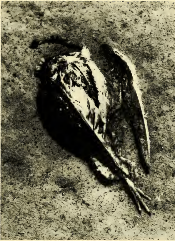
Abb. 2: Kadaver einer Lachmöwe, dicht umschwärmt von Heterocypris incongruens (kleine, dunkle Punkte), im Flachwasser. – Carcass of a Black-headed Gull, surrounded by great numbers of the oystercrad Heterocypris incongruens (small dark dots).

Abgesehen von den Ostracoden fanden sich nur noch Wasserwanzen ( Sigara lateralis L.) – meist Larven, nur wenige Imagines – in den flachen Lagunen im Freiwasser. Die Dichte betrug etwas über 10 Ex./100 cm 2 . Die Muschelkrebs-Proben enthielten 3–7 Wasserwanzen/10 ml.