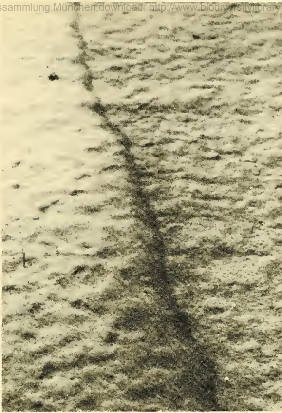
Abb. 4: Bandartige Ansammlung von Heterocypris -Muschelkrebsechen im Flachwasser ohne erkennbaren Einfluß von Strömungen oder Bodenrelief. Ein derartiges „Band“ führte von einem Vogelkadaver zu einem anderen. – Band-like concentrations of Heterocypris incongruens -ostracods in the shallow water. No influence of currents or surface structure was visible, but such a “band” led from one bird carcass to another one.