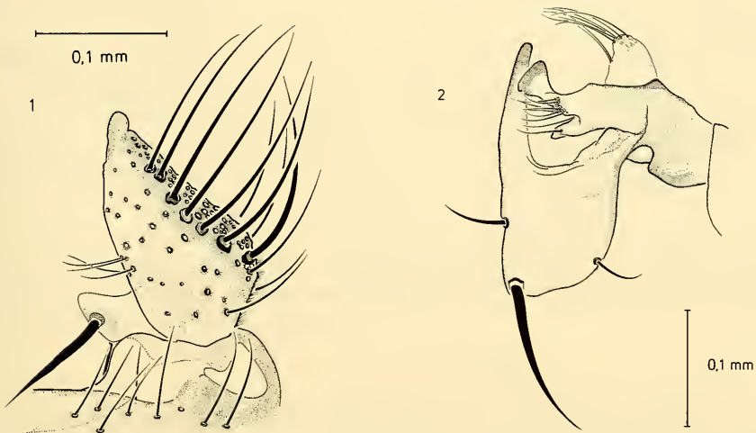
Abb. 1: Mycetophila lastovkai sp. n., Hypopyg ♂. 1. rechter, ventraler Stylomer, 2. rechter, dorsaler Stylomer

Kopf dunkelbraun; Palpen, Fühlerbasis und erstes Geißelglied gelb, die restlichen Glieder des Flagellums sind dunkel gefärbt.