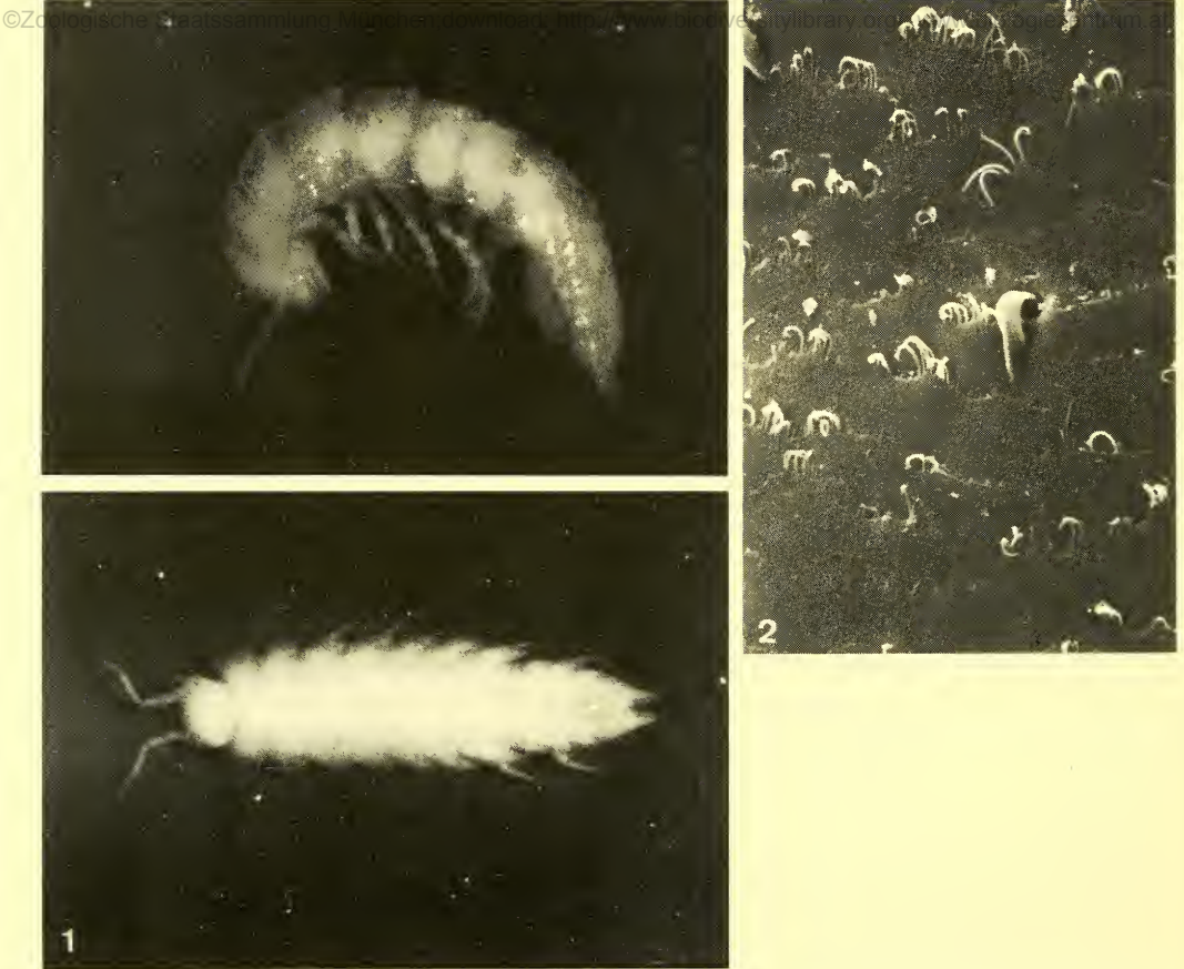
Fig. 1. Thailandoniscus annae , gen. nov., spec. nov. Animal in toto en vue dorsale et en vue latérale.