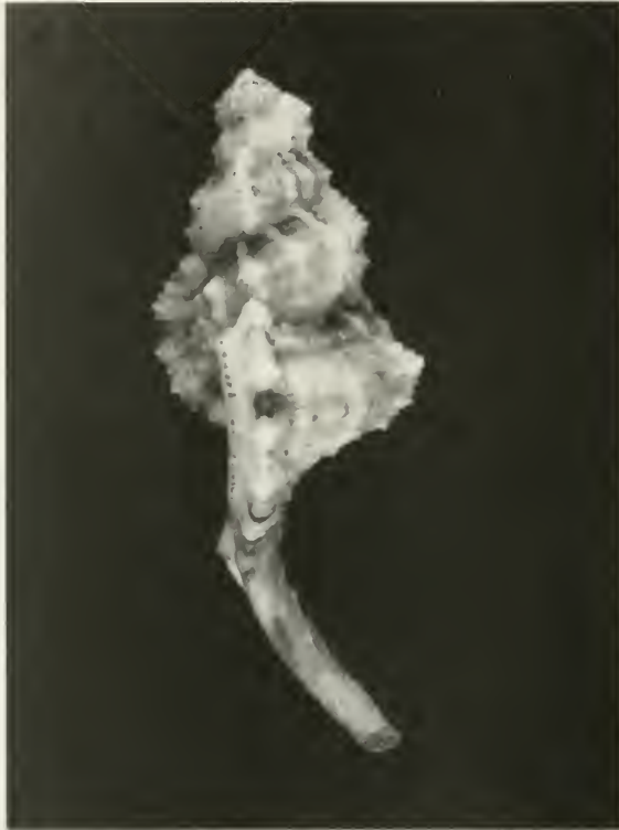
Abb. 2. Cymatium fittkai , spec. nov. Paratypus. Lateralansicht.

Typen. Holotypus: Bohol Island, Philippinen (Zoologische Staatssammlung München). — Paratypen: 2 Ex. vom gleichen Fundort (Sammlung des Verfassers).