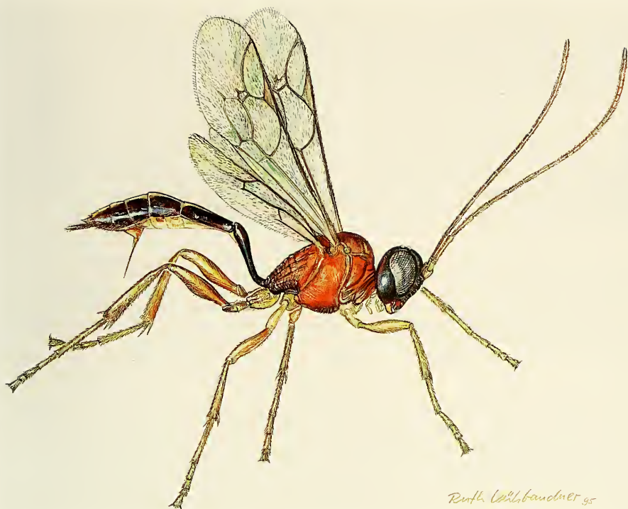
Abb. 12. Hintelmannia elisabethae , spec. nov., ♀. Habitusbild des Holotypus.

leicht verdunkelten Ring. Das schwarze Abdomen hat ab der Mitte des zweiten Tergites nach hinten einen breiten, gelben Mittelstreifen, der sich auch in die Apikalränder der restlichen Tergite zieht (Abb. 9). Die sklerotisierten Teile der Sternite sind dunkelbraun.