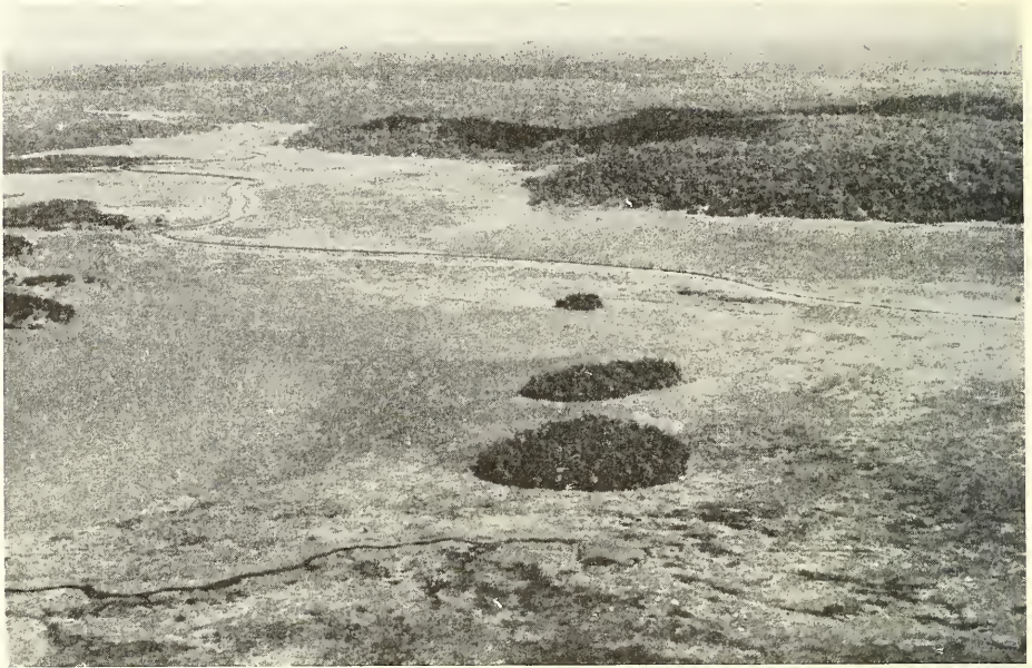
Abb. 2. Savannen und Urwaldbezirke (Luftbild östlich Gore).