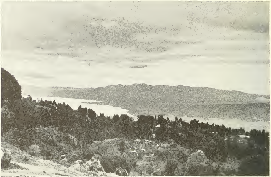
Abb. 8. Landschaft bei Gidole mit dem Süzipfel des Chamo-Sees.