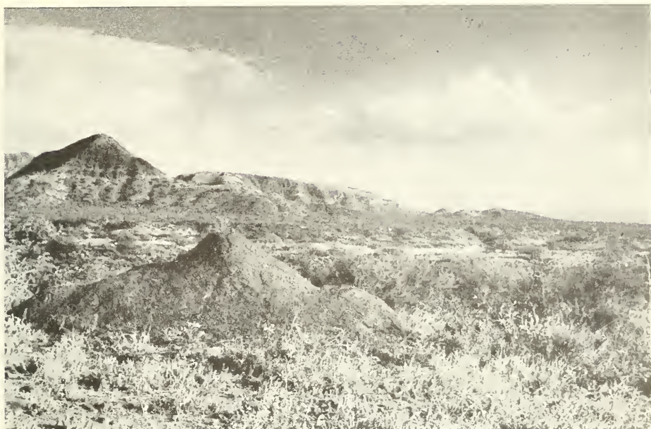
Abb. 5. Landschaft bei Awash, im Vordergrund ein Termitenhügel.

lich, denn für 1 g Rohprodukt erhält der Erzeuger im Innern des Landes 1 DM, hat also von jedem Tier eine wöchentliche Einnahme von 15 DM.