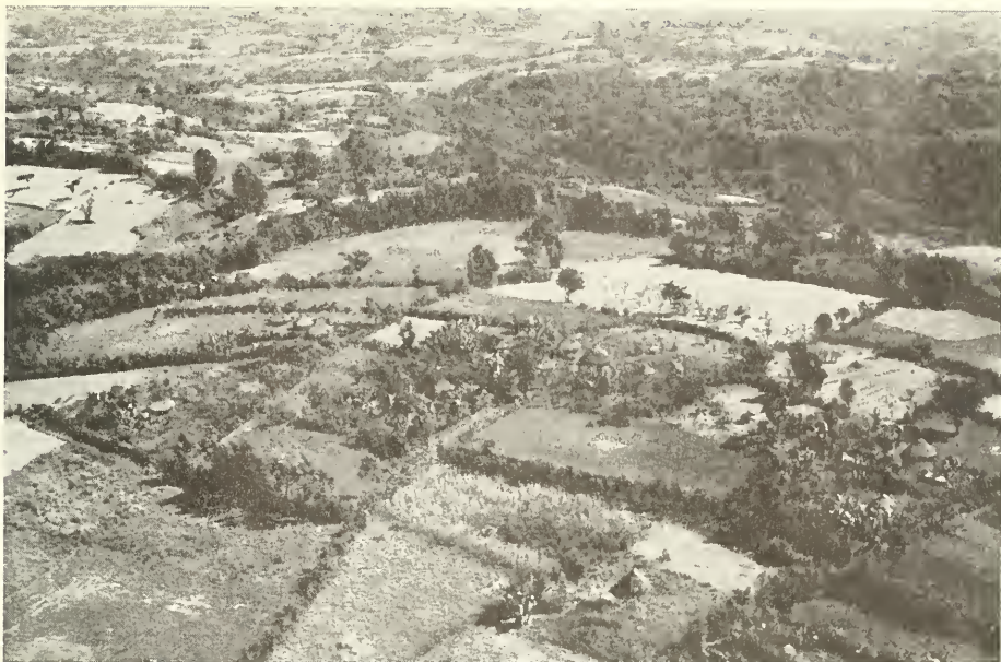
Abb. 1. Landwirtschaftlich genutztes Gebiet (Luftbild westlich Jimma).

Es ist selbstverständlich, daß in den so verschiedenartigen Gebieten des Landes auch Klimaunterschiede im Verlauf des Jahres vorkommen. Allgemein sind die Monate Dezember bis März regenarm. Von März ab fallen einzelne Schauer, die die kleine Regenzeit von April bis Mai ankündigen. Nach einer erneuten kurzen regenärmeren Periode beginnt im Juni die große Regenzeit, die bis November dauern kann. In den verschiedenen Teilen des Landes sind die Verteilung der Regenperioden und die Regenmengen recht unterschiedlich. Als Beispiel werden hier die von 2 Wetterstationen ermittelten Niederschläge gegenübergestellt. Addis Abeba, 2408 m, und Colaris Consession, 1850 m (etwa 350 km südlich von Addis Abeba). Die Daten für Addis Abeba geben den Durchschnitt aus den Jahren 1946 bis 1950 an, die für Colaris aus den Jahren 1932 bis 1939 und 1942 bis 1950 (nach SMEDS).