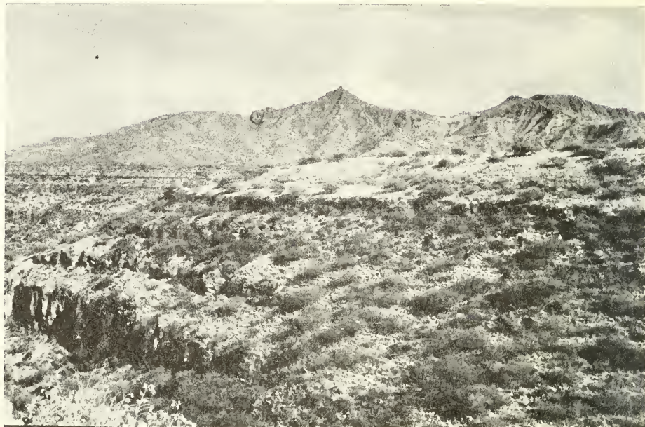
Abb. 6. Am afrikanischen Graben bei Awash.