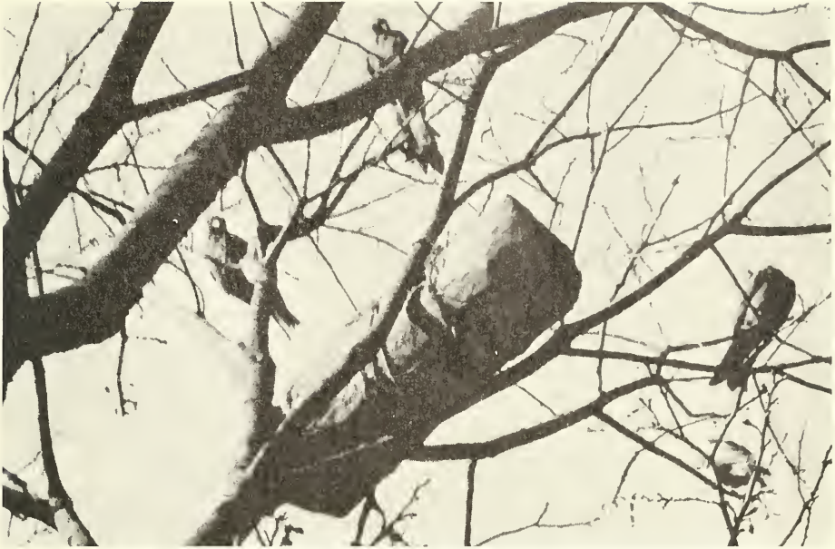
Abb. 3. Bienenbeute (Gore).

Gore ist von Addis Abeba aus in 3 Flugstunden zu erreichen. Das kuppige Hochland in der Umgebung der Hauptstadt ist zum Teil dicht besiedelt. Auf dem Weiterflug erscheinen nach Jimma mehr und mehr Waldstücke, die allmählich in weiträumige, geschlossene Urwaldgebiete übergehen. Gore liegt 2007 m hoch auf einer Hügelgruppe. Die nähere Umgebung ist dicht besiedelt, während die steilen Hänge eine üppige Vegetation tragen. Nach Südwesten fällt das Gelände zum Kunaro-Fluß ab. Der lockere Busch geht in den sumpfigen Uferbereich über, der undurchdringlichen Urwald trägt. Nach meiner Ankunft war zwar die eigentliche Regenzeit schon vorüber, einzelne Gewitter brachten aber noch heftige Regengüsse. Mittags betrug die Temperaturen im Schatten 20 bis 22° C, um Mitternacht 14 bis 16° C.