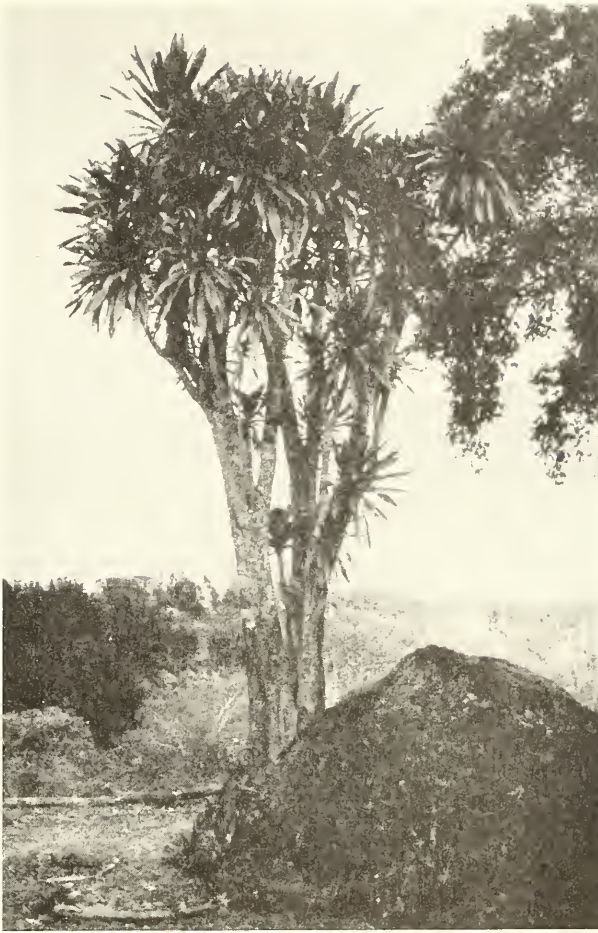
Abb. 7. Drachenbaum ( Dracaena ) bei Gidole.

genommen wurde. Die Bevölkerung setzt sich hier und weiter südlich aus Stämmen der Sidamo, Darassa und Kambatta zusammen, deren Sprachen zum kushitischen Sprachstamm gehören. Ihre Hautfarbe ist sehr dunkel, häufig erkennt man negroide Einschläge; sie leben polygam und sind zumeist heidnischer Religion. — Neben den Weiden für das Vieh und den Getreideanbauflächen sind hier große geschlossene Monokulturen von Kaffee und Ensete angelegt. Ensete edulis ist eine nichtfruchtende Bananenart, deren Stamm sehr viel stärkehaltiges Mark enthält. Nach einem Fermentierungsprozeß in Erdgruben gewinnt man daraus ein mehrlartiges Produkt, das das Hauptnahrungsmittel für die Bevölkerung bildet.