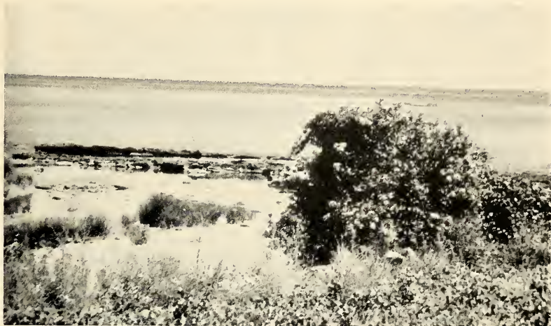
Abb. 1: Fundplatz der Zygaena laetifica leukothea n. ssp. in der Nähe vom Kap Kara Burun..

2. Was Zygaena (Agrumenia) laetifica Herrich-Schäffer anbetrifft, so herrscht immer noch Unklarheit über den Typenfundort. Bisher war nur Mesopotamien nach 1 ♂ in coll. REISS bekannt. Die Beschreibung HERRICH-SCHÄFFER's erfolgte im Jahr 1846 und die Abbildung im Jahr 1847. Diese Daten wurden dem Systematischen Katalog der Gattung Zygaena Fabricius von Hugo REISS und W. Gerald TREMEWAN entnommen. Die Angaben von HOLIK und SHELJUZHKO (1956: 115) sind zu berichtigen.