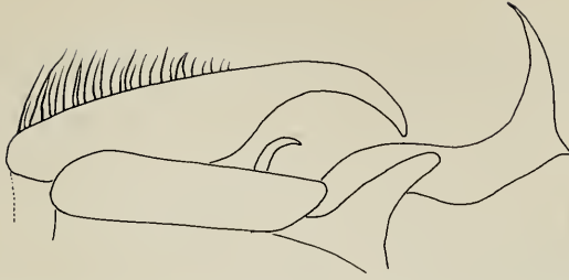
Fig. 1. Männlicher Genitalapparat von Exorista rendina n.sp. von der Seite gesehen. Cercus, Surstylus, hinteres und vorderes Paramer und Penis.