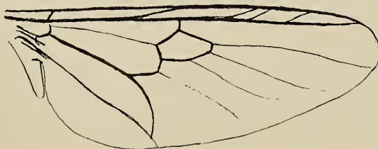
Abb. 2. Himantoloba illuminata Lind. Flügelgeäder

♂: Die Fühler sind hellbraun, mit schwarzer Behaarung der beiden Basalglieder. Der Augenwinkel der Stirn ist von einer kleinen weißen Vorwölbung ausgefüllt. Das Gesicht trägt unter den Fühlern feine kurze helle, nach oben gerichtete Behaarung. Die „Andeutung der 3 breiten dunklen Längsstreifen“ auf dem Mesonotum scheint nur sehr selten entwickelt zu sein. Das glänzend „schwarzviolette“ Mesophragma ist bei der Serie, die ich jetzt untersuchen konnte, kaum dunkler, bzw. nur rotbraun gefärbt. Es mag sein, daß beim Typus gerade diese Stelle p. m. durch die Nadel verändert worden war. Die p sind gelb. Der größere basale Teil des f_3 , der Trochanter des f_2 und der untere Teil der Sterna sind dunkelbraun, glänzend. Die dunkle Zeichnung des Abdomens ist auch auf dem ersten Tergit in einem schmalen dunklen Querstreifen entwickelt, im übrigen sind die ersten Tergite ± zeichnungslos. Die