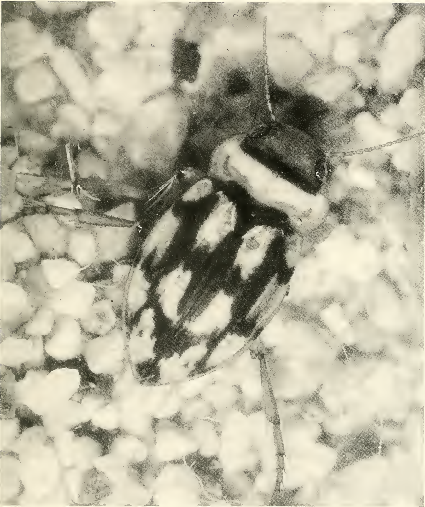
Abb. 4. Stictotarsus duodecimpustulatus (F.) [15:1], Habitus.

Funde in der DDR: HORION (1941) kennt kaum Funde östlich der Elbe. Doch kommt diese allgemein als westeuropäisch bekannte Art auch dort vor: 14. 10. 1979, NSG Niederspree bei Rietschen, 10 Ex., leg. SIEBER & RICHTER (FICHTNER 1983).