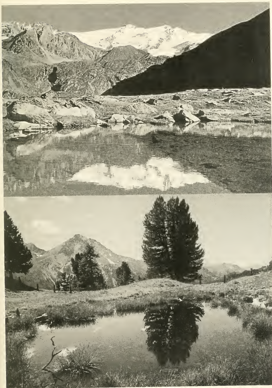
Abb. 1–2. Fundorte von Hydroporus tartaricus Leconte [8:14]. – 1. Klarer Schmelzwassersee im Madritsch-Tal, 2350 m (Ortlergebiet); – 2. Tümpel auf der Alp da Munt, 2210 m (Graubünden), hier zusammen mit Graphoderus zonatus (Hoppe) [29:2] vorkommend.