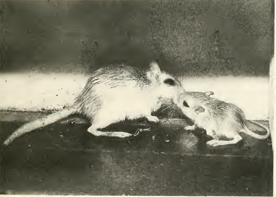
Abb. 5. (oben). Gerbillus perpallidus , Lordose-Stellung; das Männchen springt gerade vom Weibchen ab.