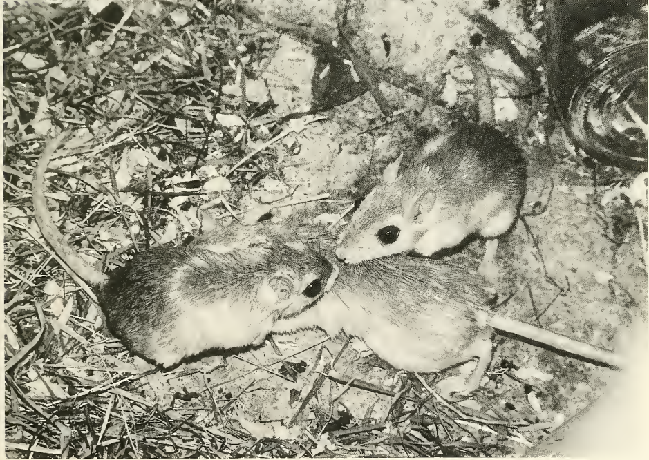
Abb. 3. (oben). Das dominante Männchen der Gruppe markiert einen Röhrenaussgang mit der Bauchdrüse.