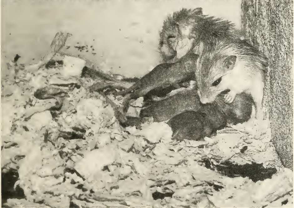
Abb. 7. (oben). Das Männchen (rechts unten) kontrolliert das Revier eines Weibchens (auf der Plattform).