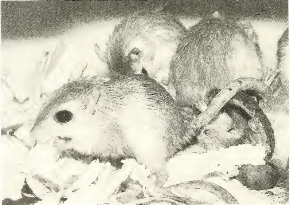
Abb. 1. (oben). Ein Männchen von Gerbillus perpallidus schiebt mit den Vorderpfoten ein Weizenkorn in den Mund. Im Hintergrund das Lager in einem Häuschen.