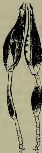
Abb. 2. Nemotelus clunipes n. sp. Mittelbeine: Links p_2 von innen, rechts p_2 von außen.