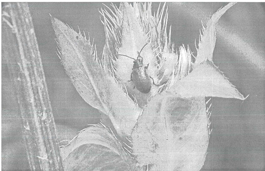
Abb. 2: Galeruca laticollis wurde in verschiedenen Gebieten Thüringens wiedergefunden. Während in anderen Gebieten Mitteleuropas vor allem die Trollblume der Art als Fraßpflanze dient, gelangen die meisten Thüringer Funde auf Kohl-Kratzdistel ( Cirsium oleraceum ).