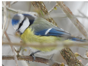
Die farbenfrohe Blaumeise im Sinkflug (Platz 8)