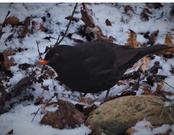
Mit der wohlklingenden Amsel geht es aufwärts. (Platz 4)