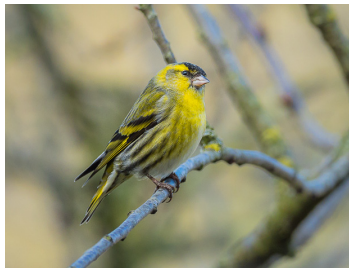
Überraschung aus dem Norden, Erlenzeisig (Platz 5)