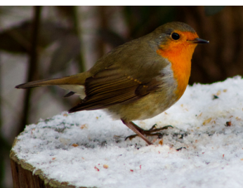
Das hübsche Rotkehlchen (Platz 11) mag es bunt.