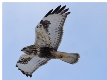
Ein Raufußbussard als nordischer Gast in Kronstorf