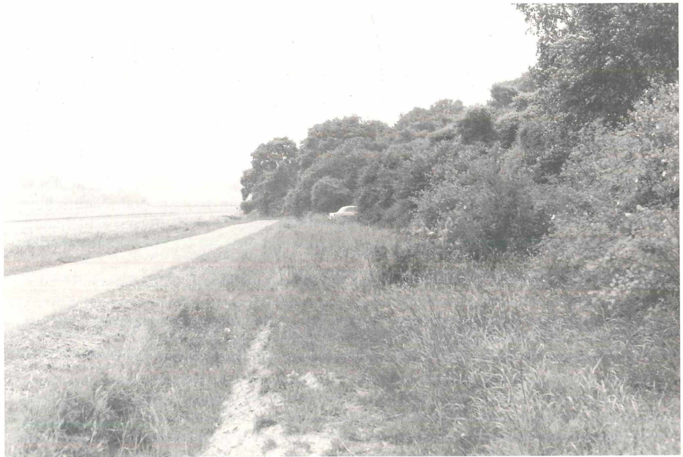
Abb. 2: Zustand des Kurricker Berges (Südhang) um 1970.