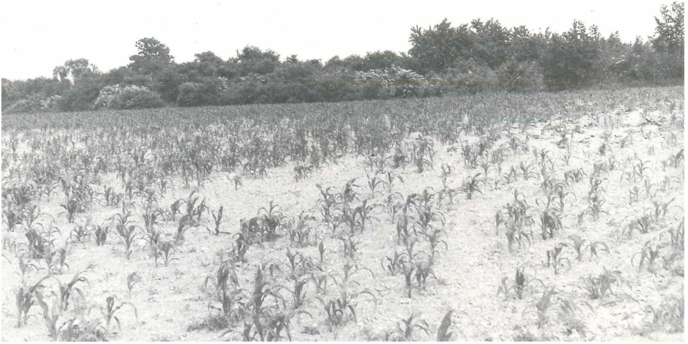
Abb. 3: Maisacker nordwestlich des Kurricker Berges um 1970