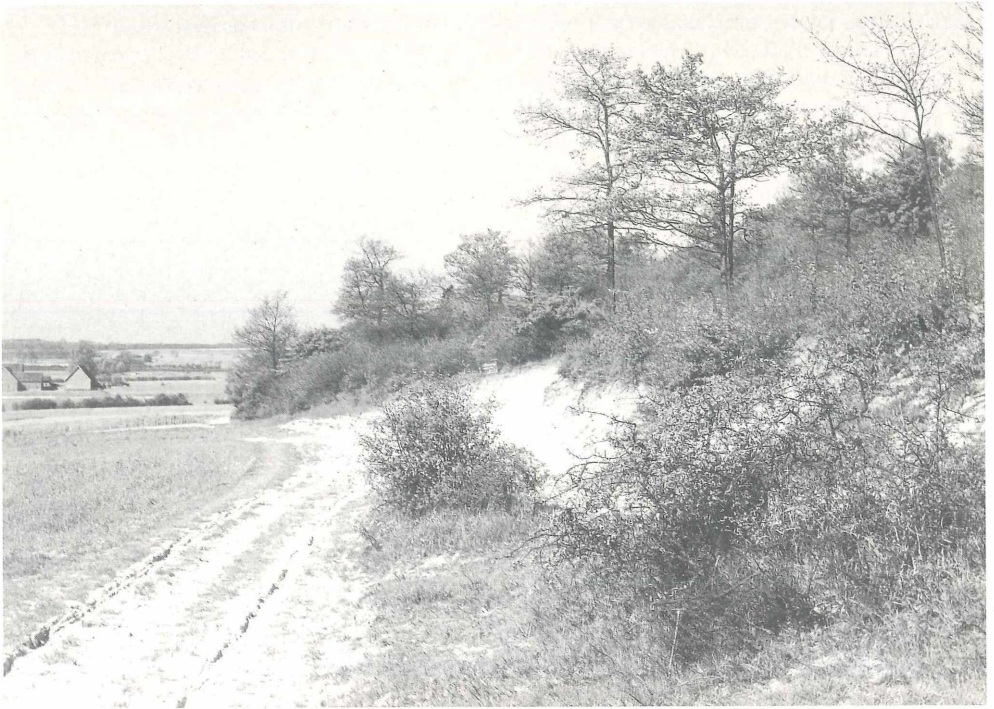
Abb. 1: Zustand des Kurricker Berges (Südhang) um 1935