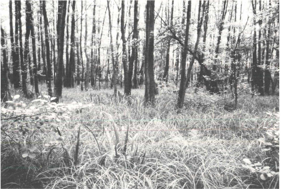
Abb. 2: Schwarzerlen-Bruchwälder ( Carici elongatae-Alnetum ) mit aspektbestimmender Sumpfschilf ( Carex acutiformis ) in der Krautschicht sind in den Feuchtgebieten des Untersuchungsraumes weit verbreitet, insbesondere im Auenbereich der Schwalm. Im Bildvorder- und -mittelgrund sind die langen, schwertförmig emporragenden Blätter der Gelben Schwertilie ( Iris pseudacorus ) zu erkennen, die an nährstoffreichen Standorten das C.-A. iridetosum gegenüber dem C.-A. typicum differenziert.