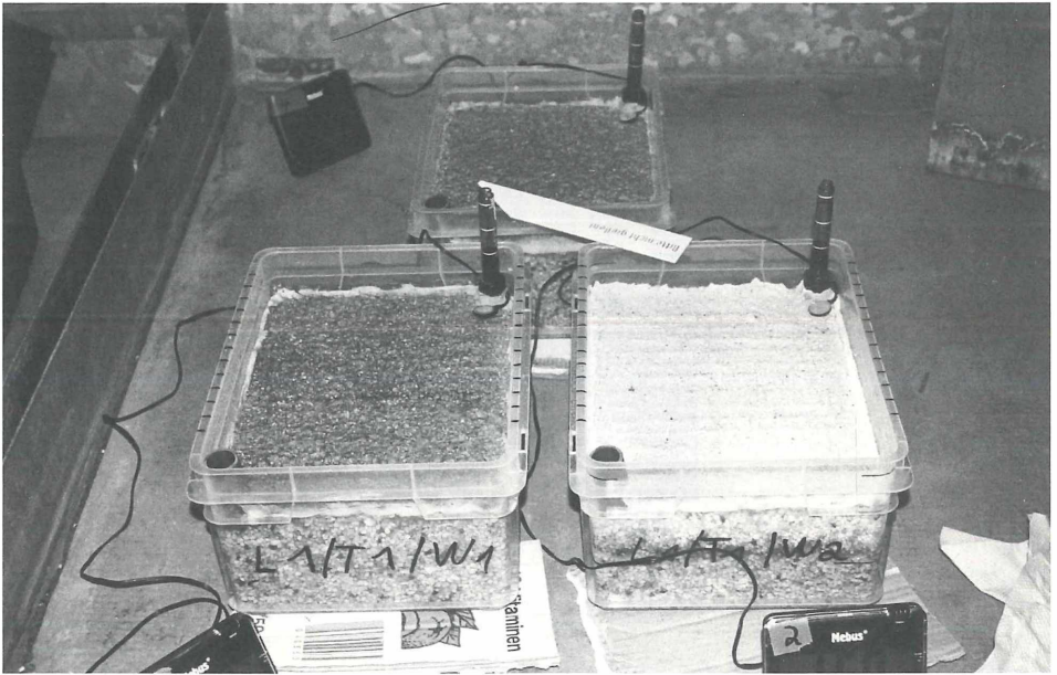
Abb. 3: Komplette Versuchsanordnung mit Min/Max-Thermometern.

Abschließend soll nicht unerwähnt bleiben, daß für eine erfolgreiche Durchführung von Aussaatversuchen weitere Parameter von größter Wichtigkeit sind. Neben ausreichendem Licht (wenn unterschiedliche Lichtverhältnisse nicht gerade Gegenstand der Untersuchung sind) ist z.B. die Art und Dauer der Lagerung der Diasporen vor Versuchsbeginn von großer Bedeutung (vgl. POSCHLOD et al. 1996, TÄUBER in Vorb.). Diese Angaben sind ebenso wie die einer vorherigen Frostbehandlung für reproduzierbare Versuchsbedingungen von entscheidender Bedeutung.