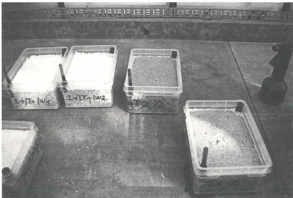
Abb. 2: Kiesgefüllte Schalen mit Gaze verklebt, z.T. mit Boden.