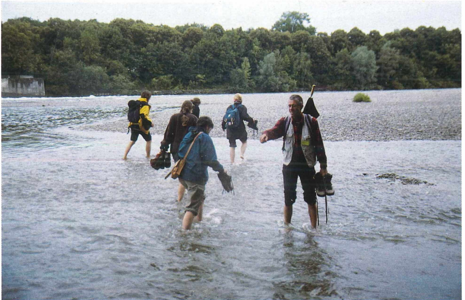
Bild 33: Die Lechauen sind ein langjähriges Forschungsgebiet von N. MÜLLER (Augsburg 1998).