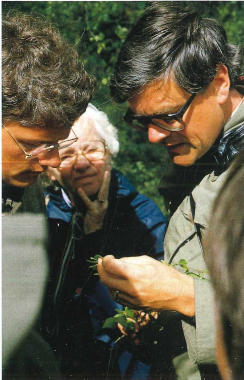
Bild 19: Neben großräumiger Vegetation ging es auch um floristische Details (R. POTT, H. HAEUPLER 1984).