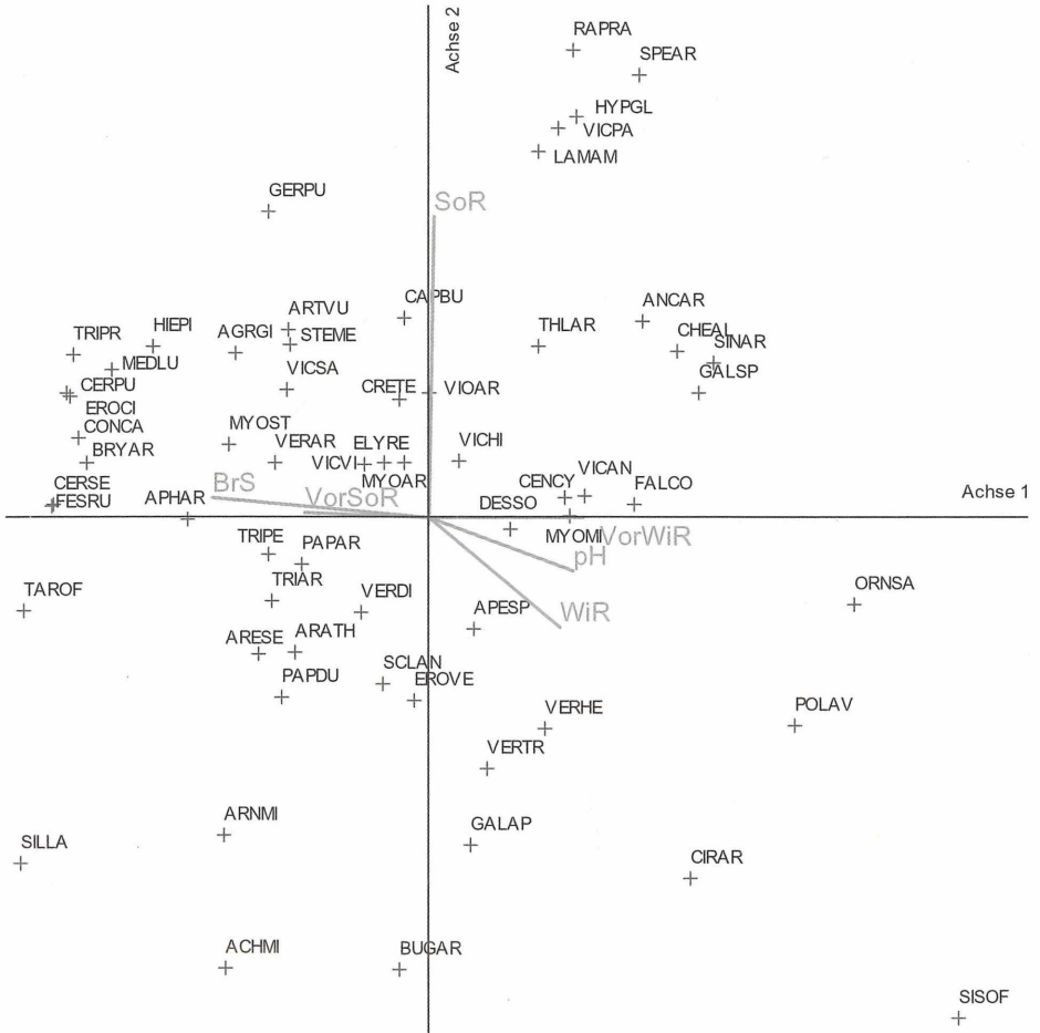
Abb. 2: DCA-Biplot der Artenzusammensetzung der Vegetationsaufnahmen und Standort- sowie Bewirtschaftungsparameter auf der Untersuchungsfläche