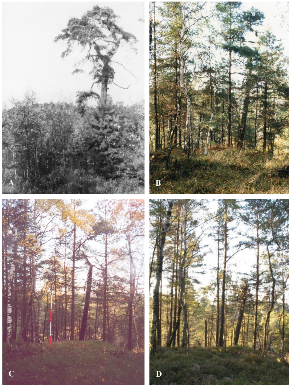
Abb. 1. Ansicht der Dauerbeobachtungsfläche 4 (Brand: 1953). A) 1963, B) 1992, C) 2002, D) 2014. Der Pinus sylvestris -Altbaum von 1963 ist vor 1992 abgestorben, während der Jungwuchs von Betula pendula und P. sylvestris inzwischen die obere Baumschicht erreicht hat und den Stumpf des Altbaums überschattet.

Fig. 1. Aspect of permanent observation plot 4 (fire: 1953). A) 1963, B) 1992, C) 2002, D) 2014. The overmature individual of Pinus sylvestris A perished before 1992, while the young individuals of Betula pendula and P. sylvestris have reached the upper canopy layer in the meantime, shading the remaining stump of the dead P. sylvestris .