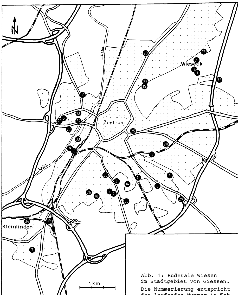
Abb. 1: Ruderale Wiesen im Stadtgebiet von Giessen. Die Nummerierung entspricht der laufenden Nummer in Tab. 1.

material der Bodenbildung wasserableitend, da es häufig einen hohen Anteil an Schuttmaterial enthält.